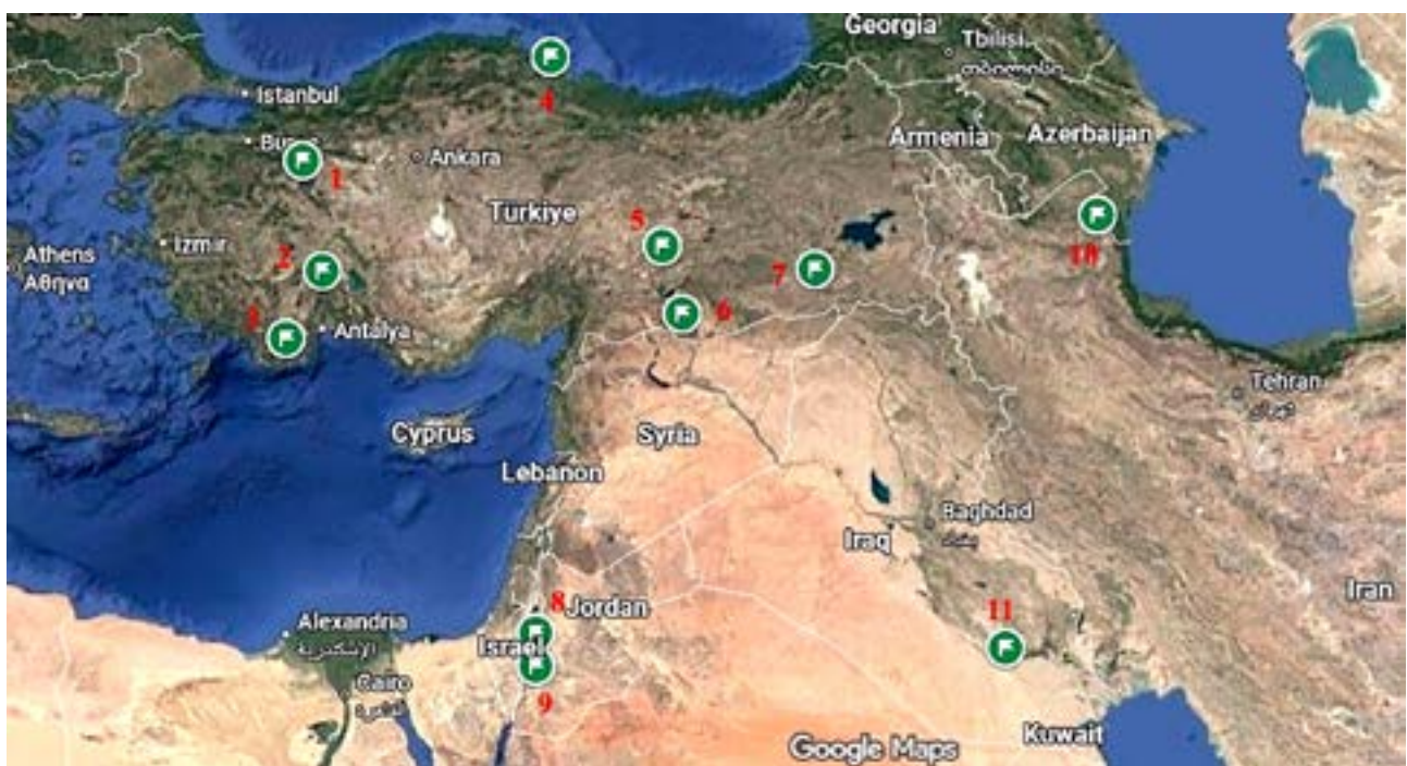
Рис. 9. Археологические памятники с травмами летального характера: 1 – Сарыкет/Демирчигуюк; 2 – Харманйорен; 3 – Караташ; 4 – Икизтепе; 5 – Арслантепе; 6 – Титриш Гуюк; 7 – Башур Гуюк; 8 – Баб эдх-Дхра; 9 – Вади Файнан 100; 10 – Гилар; 11 – Ур