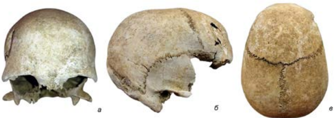
Рис. 3. Женский череп из разрушенного погребения.