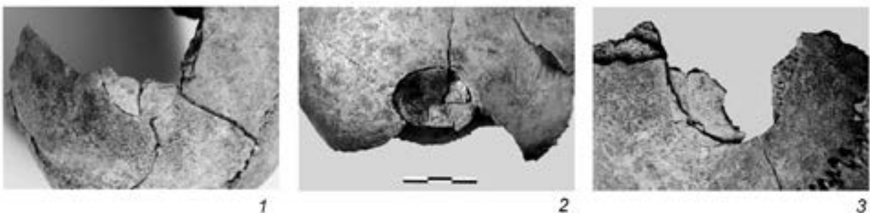
Рис. 10. Травматические повреждения на черепах из Арслантепе: 1 – женский череп (Cr2); 2 – мужской череп (Cr3); 3 – мужской череп (Cr12). [35, fig. 2. b, c, f]