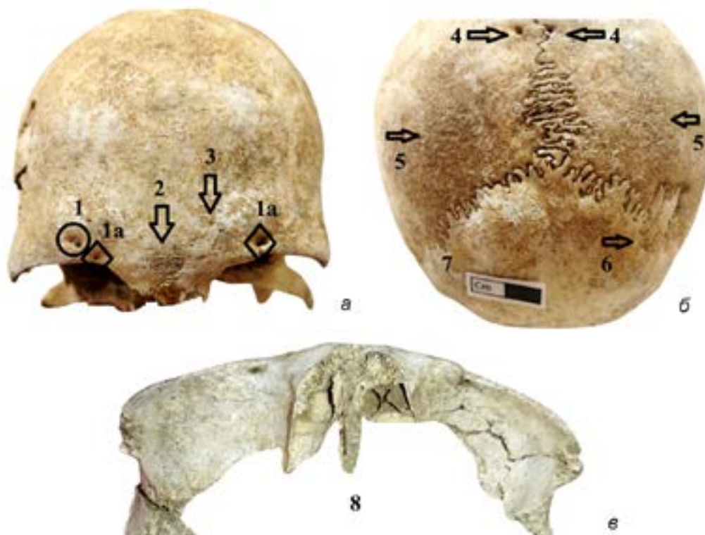
Рис. 6. Патологии и дискретно-варьирующие признаки на женском черепе из Гилар. 1 – Foramen frontale; 1a – Foramen supraorbitale; 2 – Sutura supranasale; 3 – Васкулярная реакция; 4 – Foramen parietale; 5 – Порогический гиперостоз; 6 – Os suturae lambdaeidea; 7 – Доброкачественная опухоль; 8 – Cribrata orbitalia.