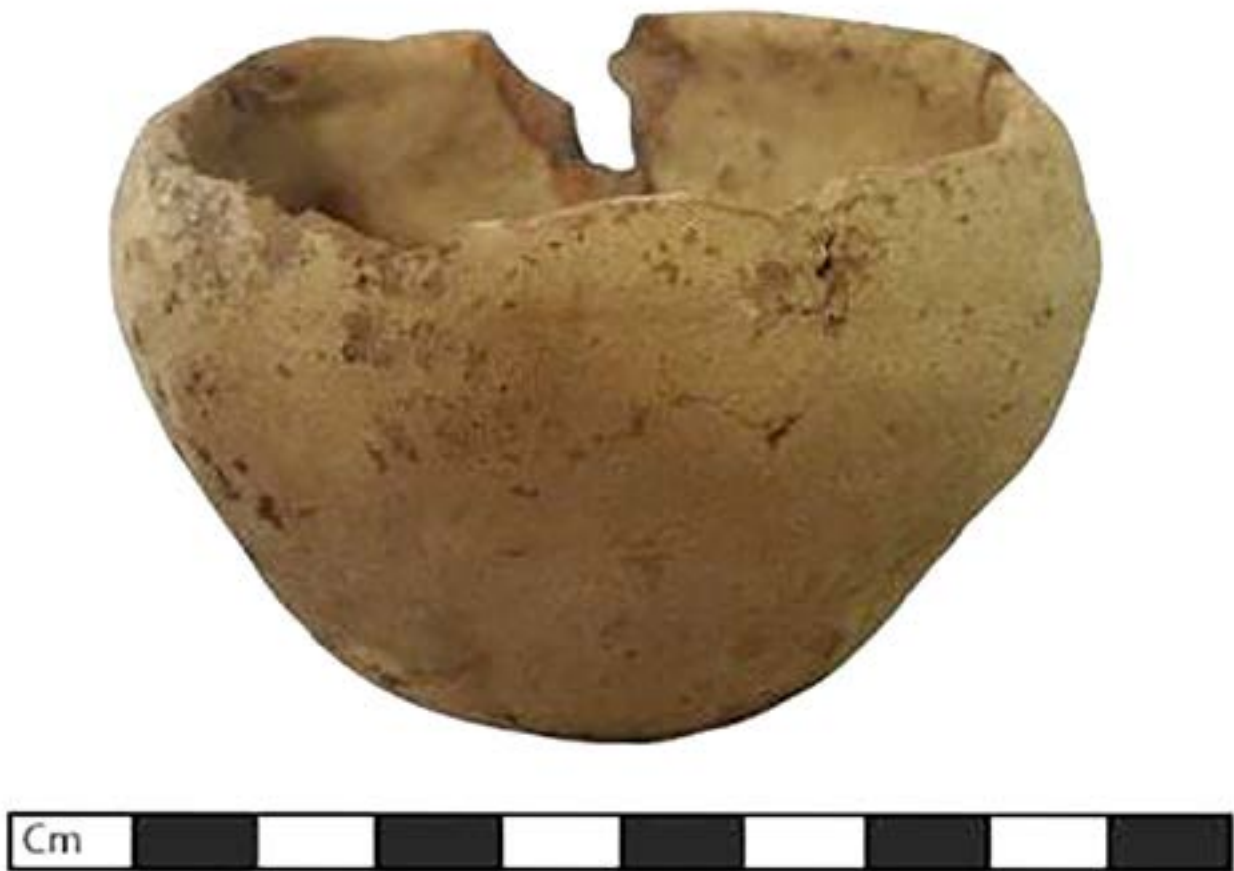
Рис. 2. Чаша из разрушенного погребения.