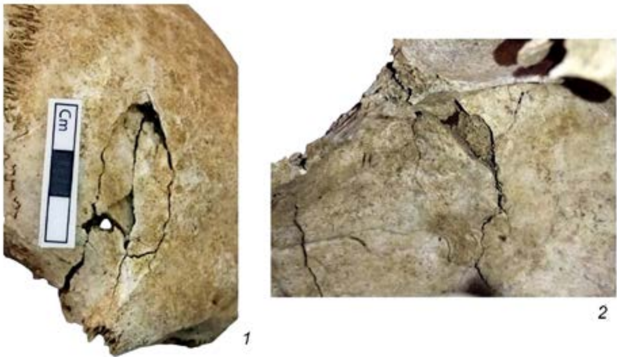
Рис. 4. Травматическое повреждение на женском черепе из Гилар. 1 – Вид снаружи; 2 – Вид изнутри.