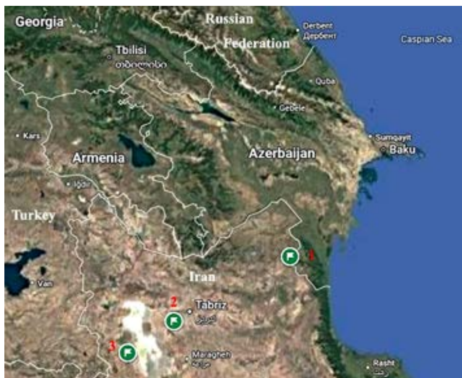
Рис. 7. Археологические памятники. 1 – Гилар; 2 – Яныктепе; 3 – Геойтепе