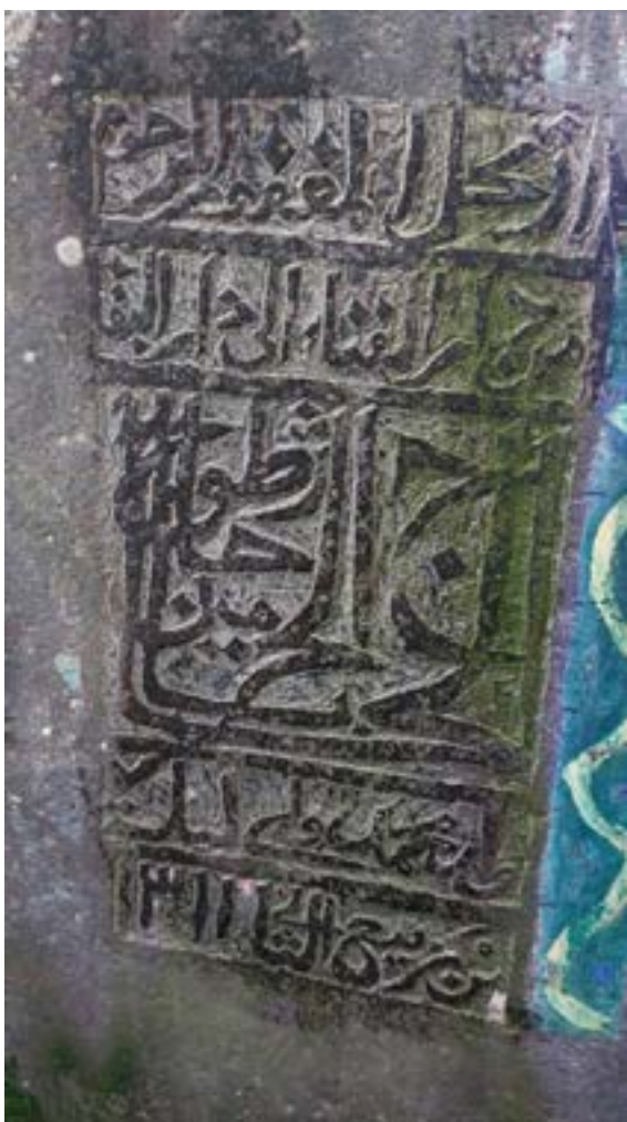
Рис. 5. Арабоязычная надпись на могиле паломника двух святынь Хаджи Зетов, сына Мухаммада-вали. Закаатальский район, муниципалитет Джар