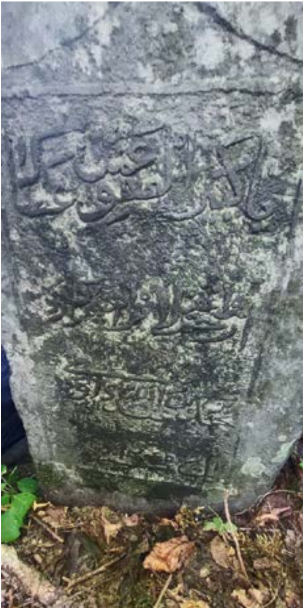
Рис. 6. Могила Ибрахима, сына Давуда, сына Мухаммада, сына Абдуллаха, сына Давуда аль-Джари. Закаतालский район, муниципалитет Джар