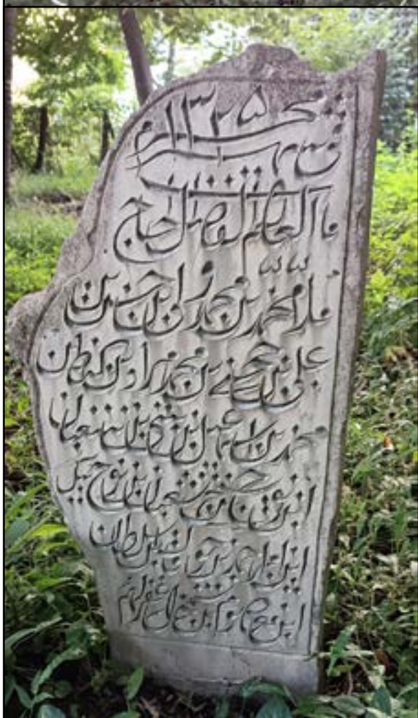
Рис. 3. Надмогильная стела с генеалогией тухума Кинтазул – ответвления тухума Нухиял. Закатальский район, муниципалитет Даначи