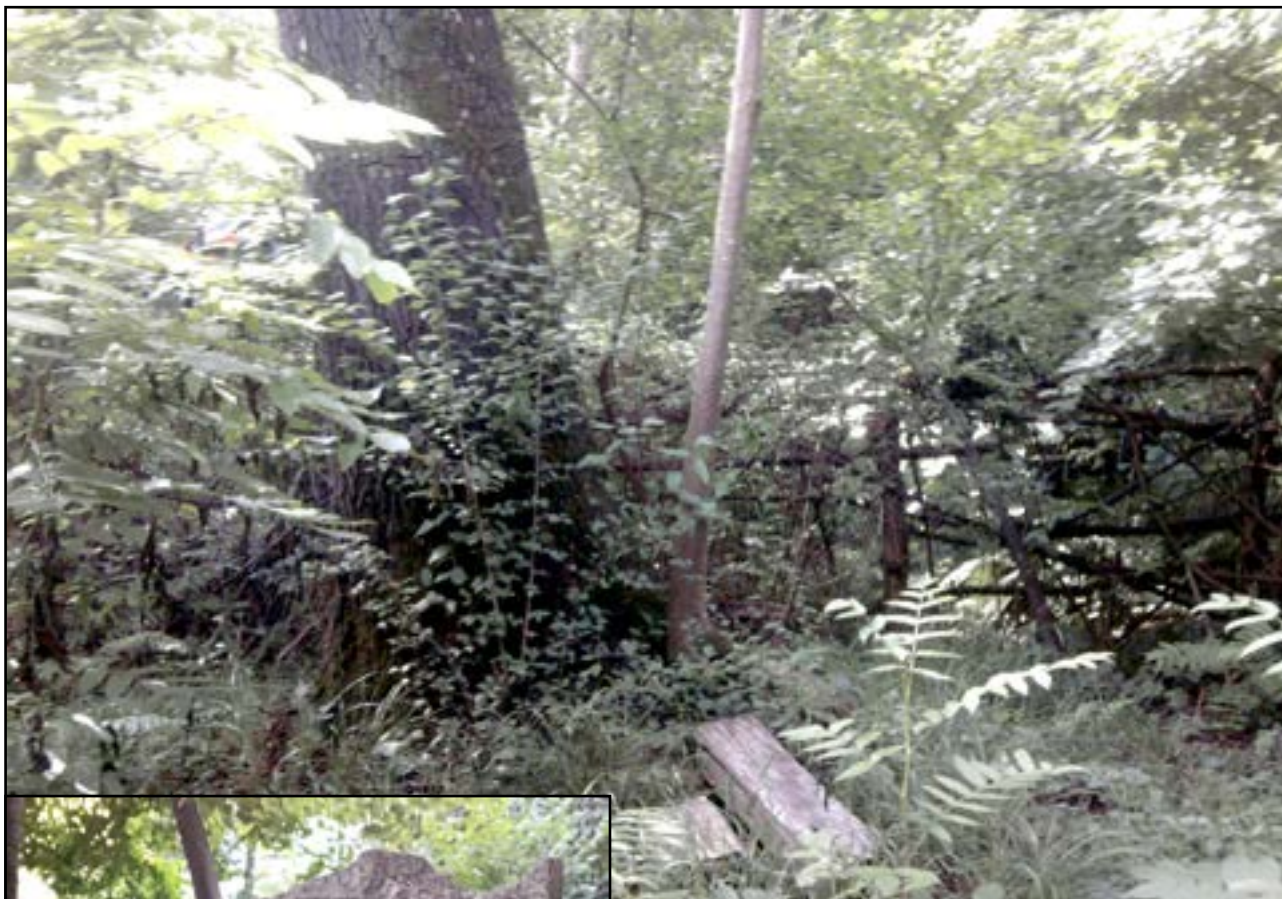
Рис. 2. Место гибели Наккахасана, представителя рода Нухиял. Закатальский район, муниципалитет Даначи