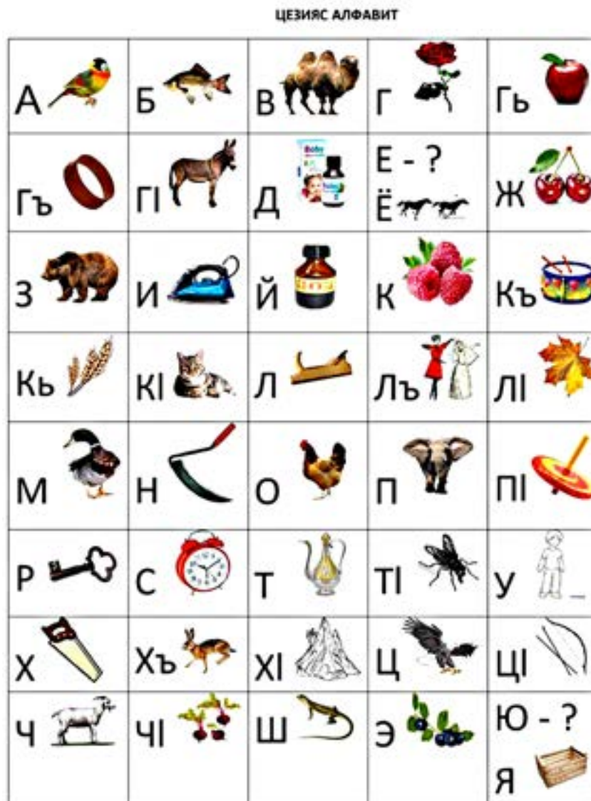
Рис. 5 Цезский алфавит, созданный М.Е. Алексеевым