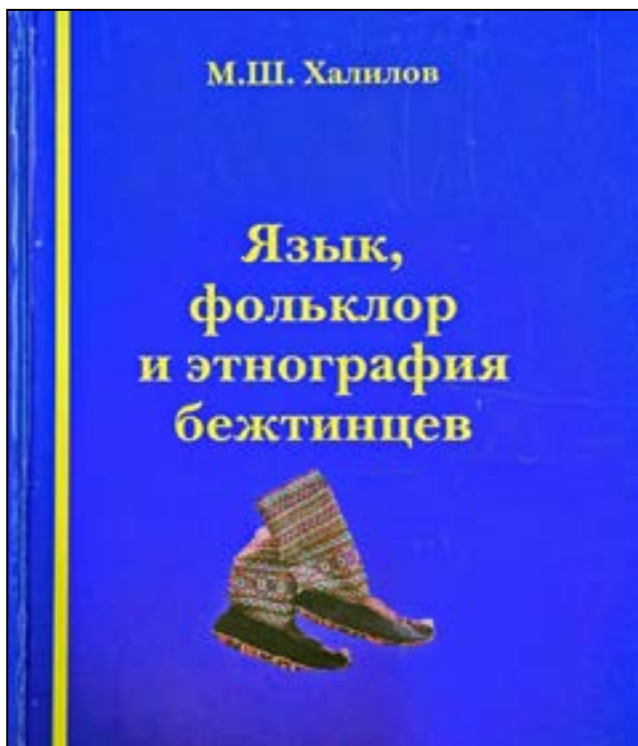
Рис. 2 Обложка книги М.Ш. Халилова «Язык, фольклор и этнография бежтинцев»