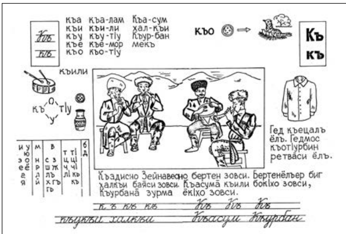
Рис. 4 Страница из «Букваря цезского языка»