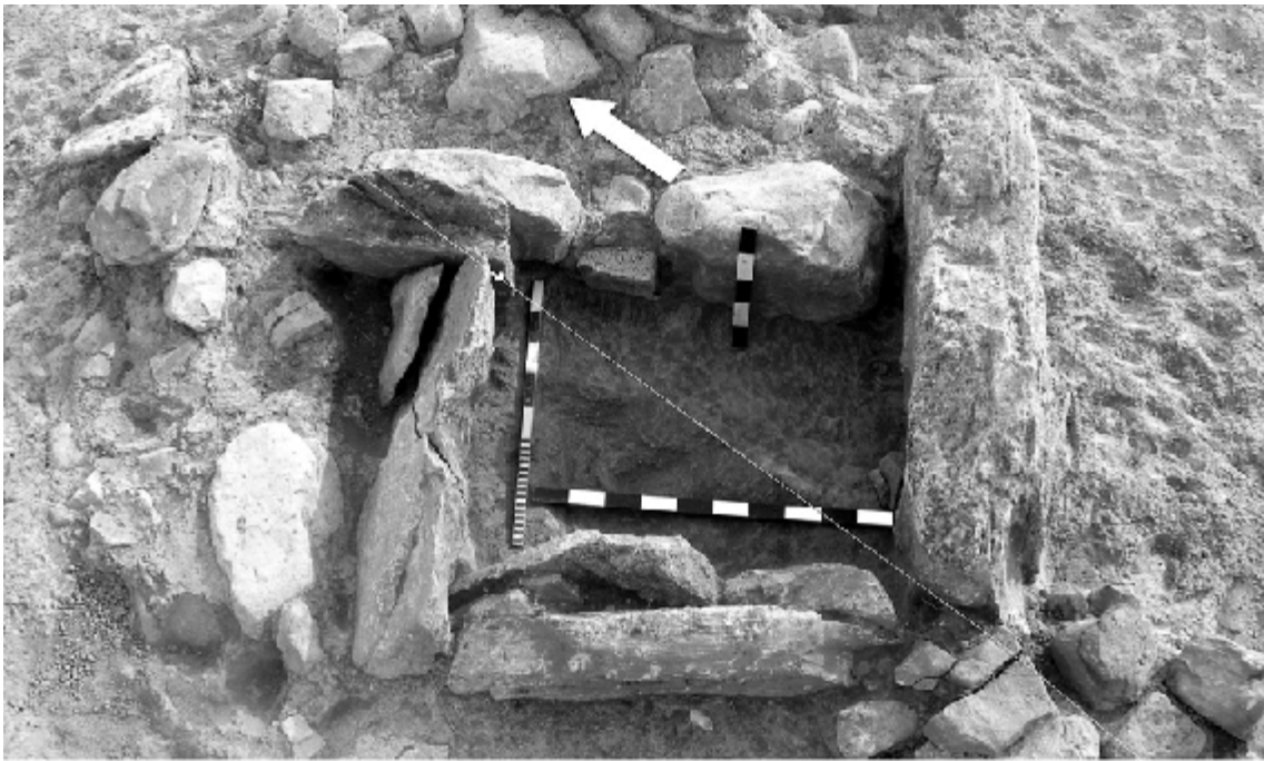
Рис. 3. Могильник Таулар-гол. Курган 4. Каменный ящик.