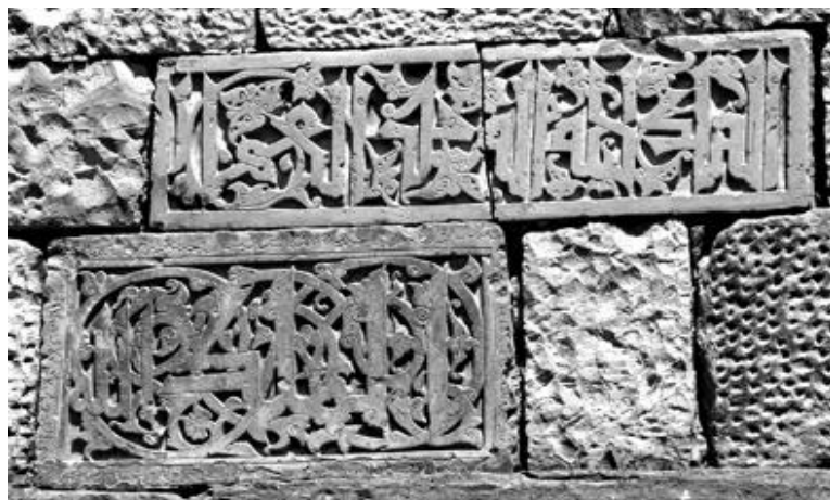
Рис. 8. Два рельефа с арабскими надписями в кладке южной стены Большой мечети в нижнем квартале пос. Кубачи. XV в.