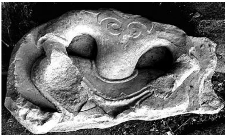
Рис. 4. Часть рельефа с изображением сидящего по-восточному мужчины, обнаруженная при реставрации старого жилого дома М. Хакачиева в нижнем квартале пос. Кубачи. XIV–XV вв.