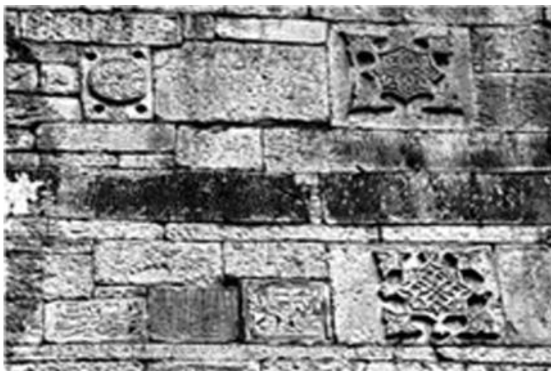
Рис. 19. Каменные рельефы в кладке стены южного фасада мечети в с. Ашты. XVI–XVII вв.