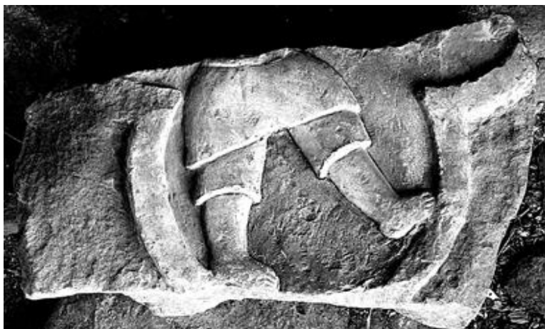
Рис. 5. Часть рельефа с изображением человека, обнаруженная при реставрации старого жилого дома М. Хакачиева в нижнем квартале пос. Кубачи. XIV–XV вв.