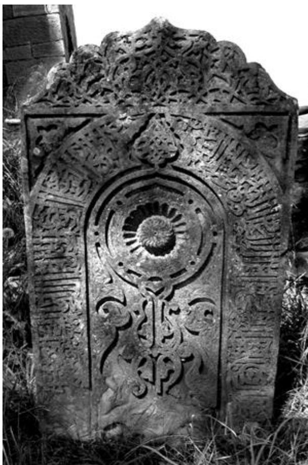
Рис. 18. Надмогильный памятник, находящийся на уцмийском (ханском) кладбище в с. Калакорейш. XVIII в.