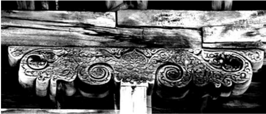
Рис. 15. Резная деревянная подбалка на лоджии второго этажа жилого дома Г. Багаева в среднем квартале пос. Кубачи. 1295 год хиджры / 1878 г.