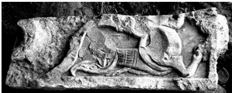
Рис. 6. Часть рельефа с изображением животного с повернутой назад головой (отбита преднамеренно), припавшего на передние конечности, обнаруженная при реставрации старого жилого дома М. Хакачиева в нижнем квартале пос. Кубачи. XIV–XV вв.