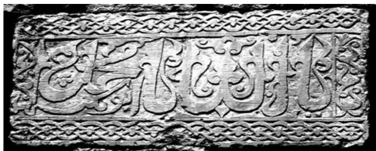
Рис. 14. Каменный рельеф с арабской надписью и растительным орнаментом в кладке второго этажа восточной стены квартальной мечети в самой нижней части пос. Кубачи. XV в.