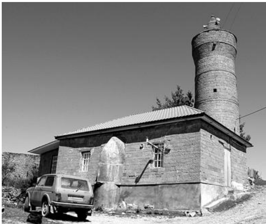
Рис. 20. Сельская мечеть с минаретом в старой части с. Уркарах, называемой ЧибяхIши (Верхнее селение) с каменными рельефами начала XIX–XX вв. с арабскими надписями в кладке стен южного и восточного фасадов.