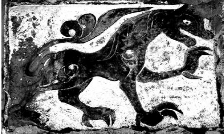
Рис. 2. Рельеф с изображением зверя в кладке восточной стены второго этажа жилого дома Р. Гакачиева (бывший дом Б. Султанова) в верхнем квартале пос. Кубачи. XV в.