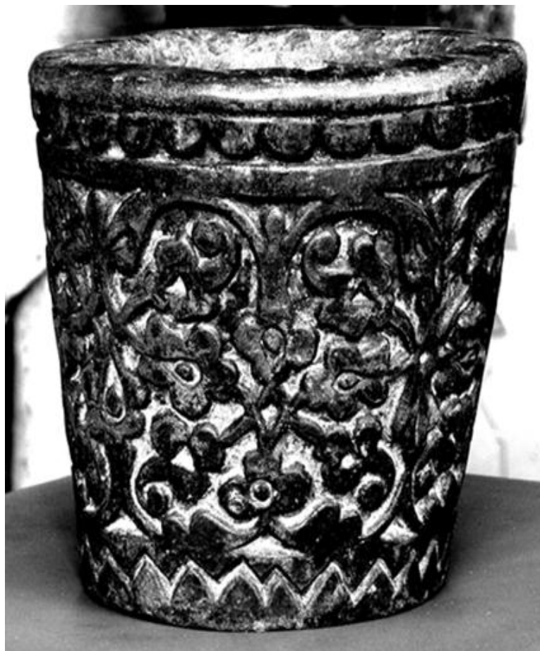
Рис. 10. Каменная ступка для толчения чеснока, принадлежащая жительнице верхнего квартала пос. Кубачи Бике Акаевой. Конец XVIII или самое начало XIX в.