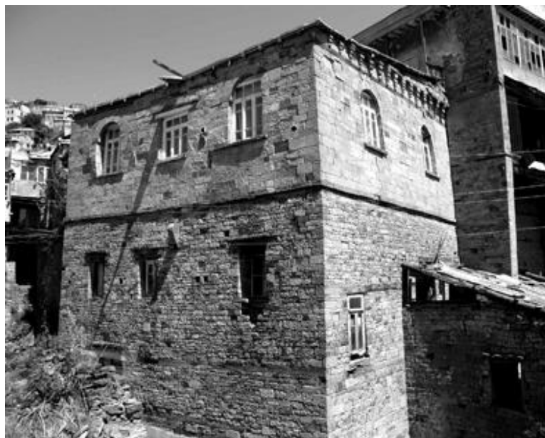
Рис. 12. Ныне действующая мечеть на границе среднего и нижнего кварталов пос. Кубачи. В кладке стен южного и восточного фасадов – каменные рельефы XV–XIX вв.