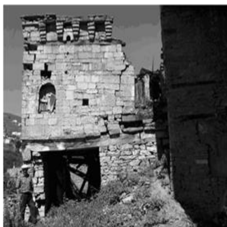
Рис. 13. Квартальная мечеть в самой нижней части пос. Кубачи. В кладке стен восточного, южного и западного фасадов имеются каменные рельефы с арабскими надписями (1 рельеф с персидской надписью) и растительным орнаментом. XIV–XIX вв.