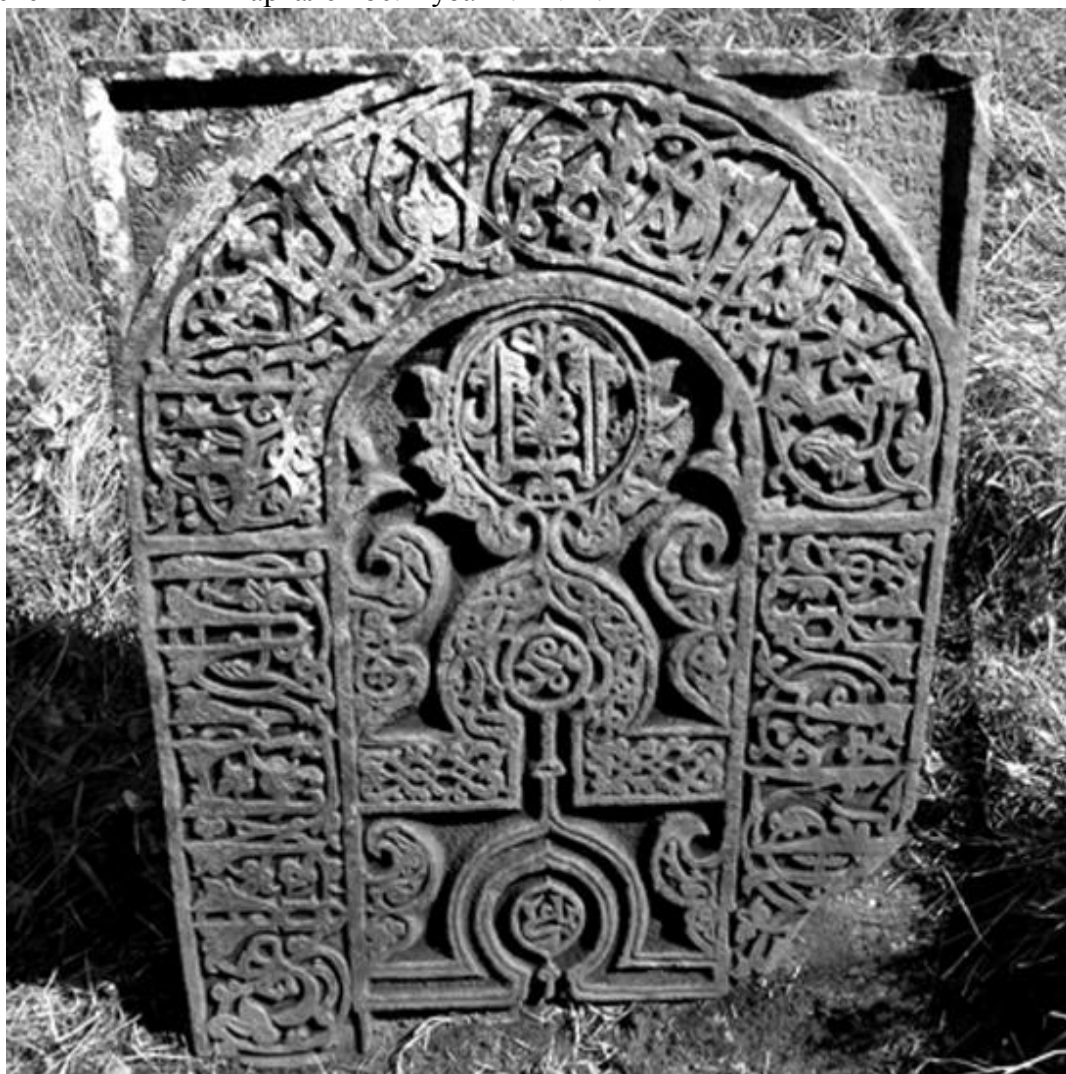
Рис. 9. Надмогильный памятник с арабскими надписями и растительным орнаментом. Старое кладбище «Бидахъ хуппе» близ нижнего квартала пос. Кубачи. 783 год хиджры / 1381–82 гг.