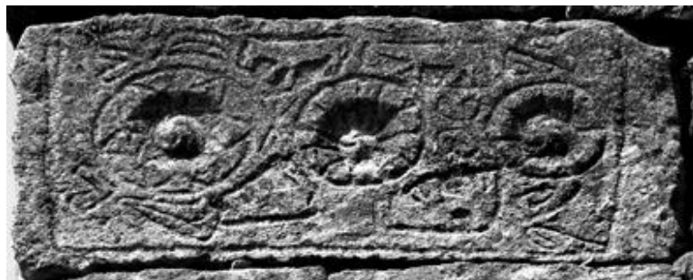
Рис. 17. Петроглиф в восточной стене второго этажа полуразрушенного жилого дома в с. Амузги. XIV–XV вв.