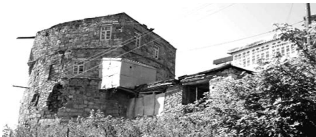
Рис. 11. Оборонительная трехэтажная башня Акайла-кала, переделанная в конце XIX или начале XX в. в жилой дом. Верхний квартал пос. Кубачи. XIII–XIV вв.