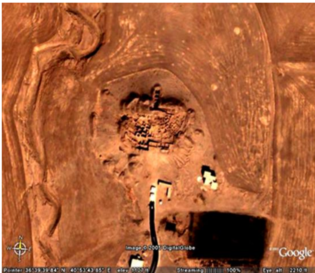
Рис. 1. Телль-Хазна I. Снимок с космоса. Фото 2004 г.