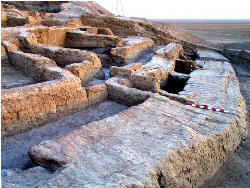
Рис. 3. Телль-Хазна I. Обводная стена. Фото 2004 г.