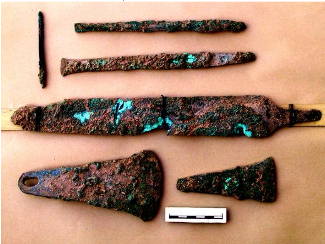
Рис. 4. Телль-Хазна I. Бронзовые орудия из клада.