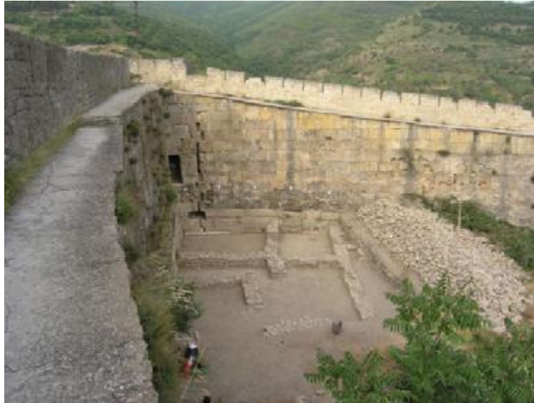
Рис. 1. Дербент. Цитадель Нарын-кала. Раскоп XXIII. Второй строительный комплекс.

Стратиграфический раскоп 2 (2x2 м), заложенный на одном из всхолмлений городища в его центральной части, выявил культурные напластования толщиной около 2 м, датируемые по однообразному керамическому комплексу, представляющему характерные образцы сасанидской керамики, V–VI вв. Среди индивидуальных находок выделяются костяная концевая обкладка лука с пазом для крепления тетивы, а также костяной стиль с навершием в виде кисти правой руки, сжатой в кулак и с поднятым указательным пальцем (рис. 2).