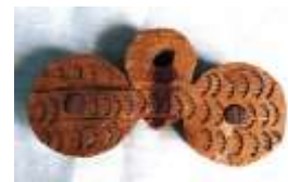
Рис. 1. Резьба на деталях ткацкого стана (1,2 – набелки; 4 – блочки). Солярный мотив в резьбе на набелках (3)