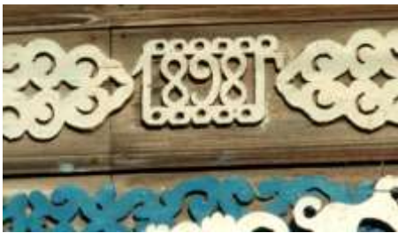
Рис.5. Образцы глухой резьбы (1, 2) и пропильные узоры (3, 4) на наличниках. «Вазон» в орнаменте наличников (3).