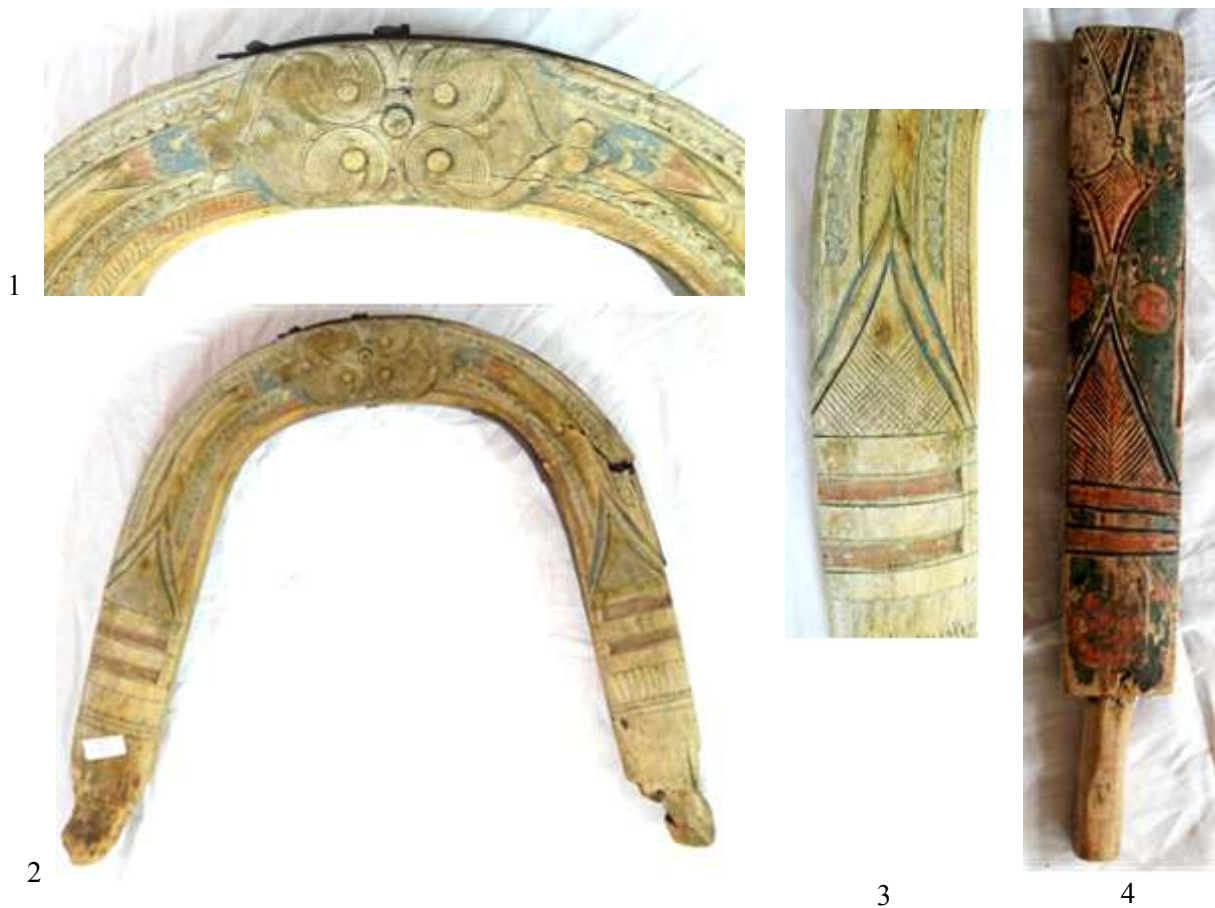
Рис. 7. Резной орнамент дуги (1 – 3) и валеk, сделанный из дуги (4)