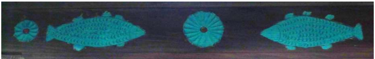
Рис. 3. Украшенные резьбой вальки (1 – 3) и пряничные доски (4 – 7)