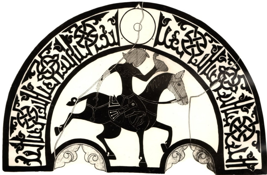
Рис. 8. Тимпан двупроемного окна из с. Кубачи с изображением конного всадника и эпиграфическим орнаментом (подражание арабской позднекуфической надписи) в полукруге. Конец XIV – начало XV в. ДГОМ. Прорисовка