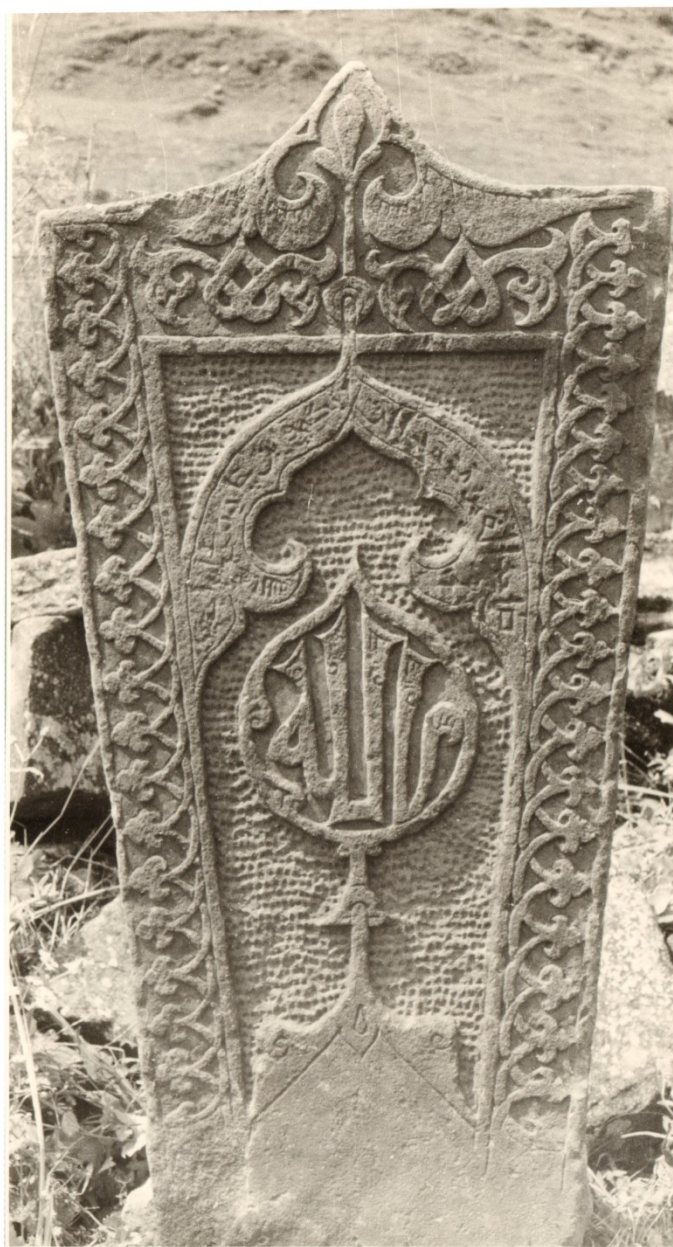
Рис. 2. Надмогильный памятник из с. Кубачи с растительным орнаментом и арабскими надписями. Конец XIV – начало XV в. Фото 1976 г. Кладбище «Бидахъ хуппе»