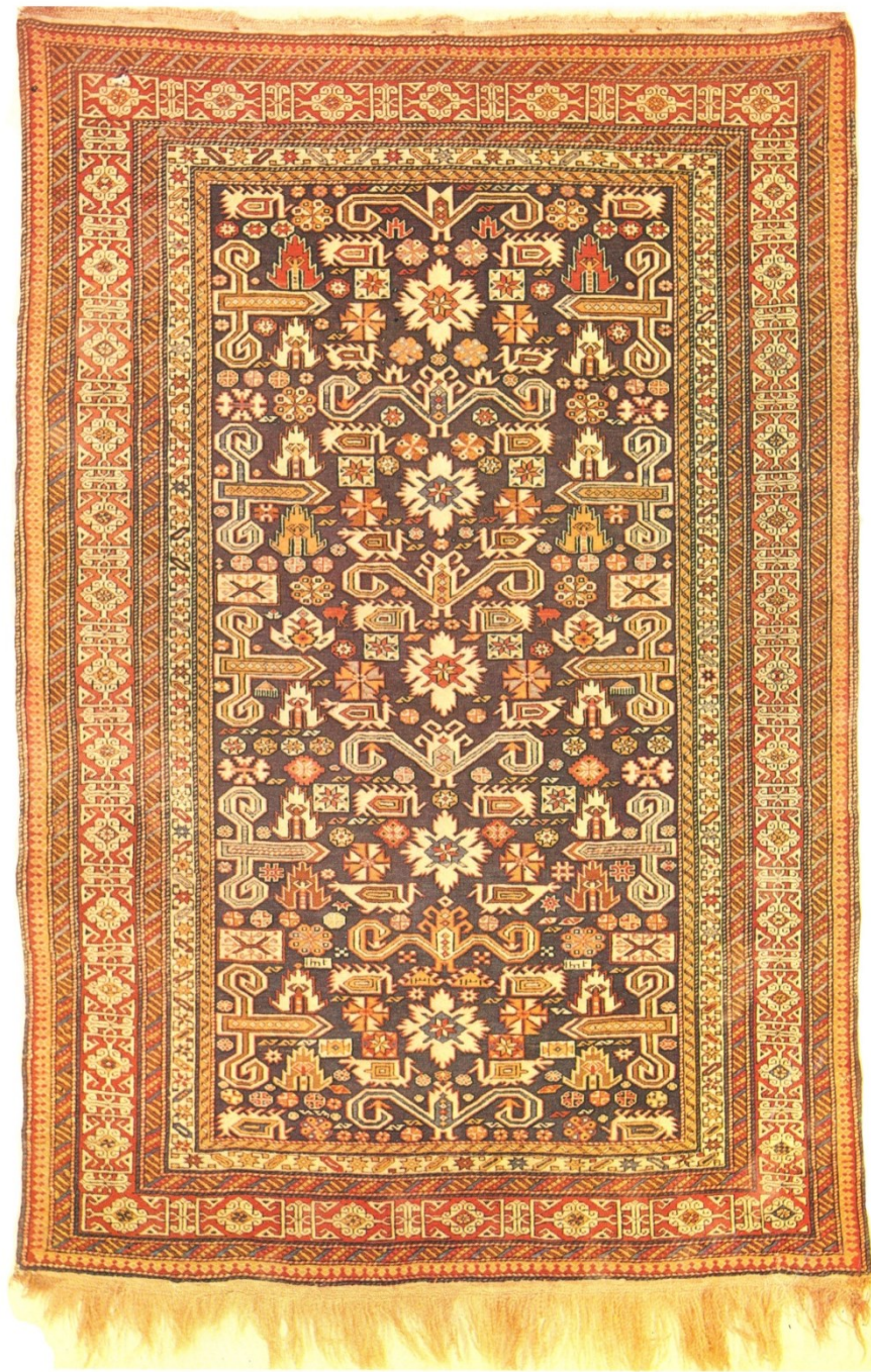
Рис. 10. Азербайджанский ворсовый ковер «Пиребедиль» кубинской группы. Конец XIX в. Широкая бордюрная полоса «шами», составные элементы которой восходят к арабскому почерку куфи. По Л.Г. Керимову