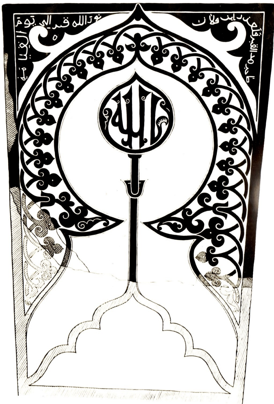
Рис. 4. Надмогильный памятник из с. Кубачи с растительным орнаментом и арабскими надписями. Начало XV в. Прорисовка. Кладбище «Бидахъ хуппе»