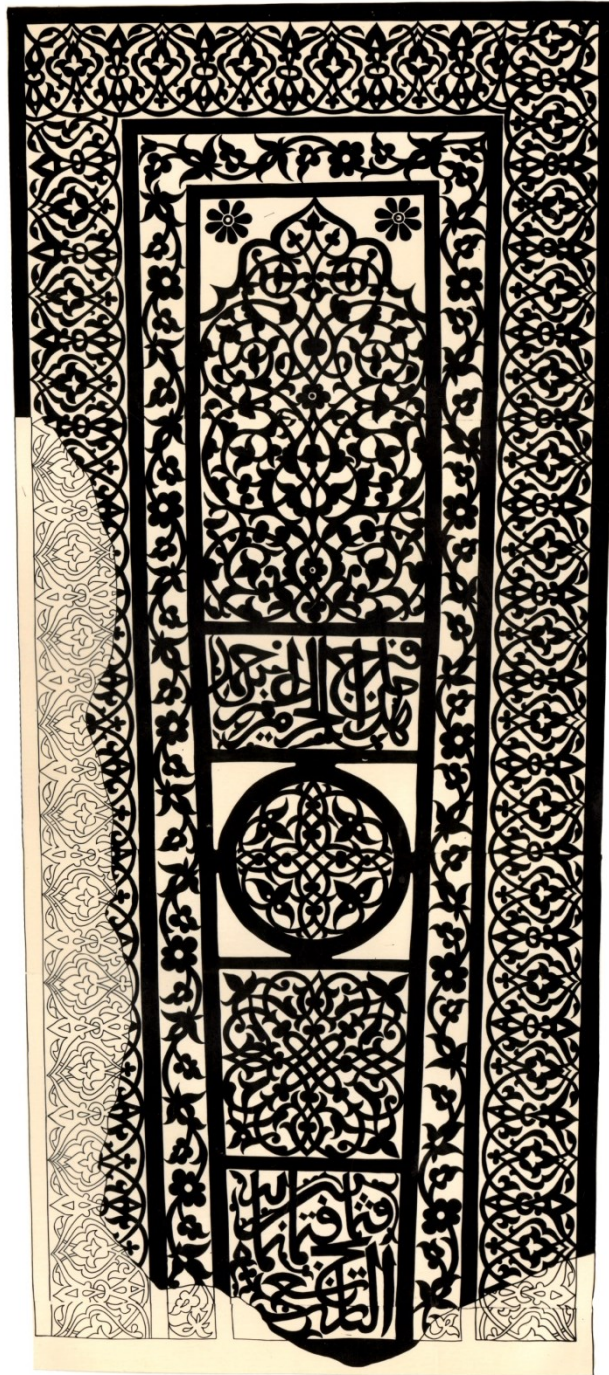
Рис. 6. Надмогильный памятник из с. Кумух Лакского района с растительным орнаментом и арабскими надписями 889 г. хиджры /1484–85 гг. Прорисовка памятника, воспроизведенного на рис. 5