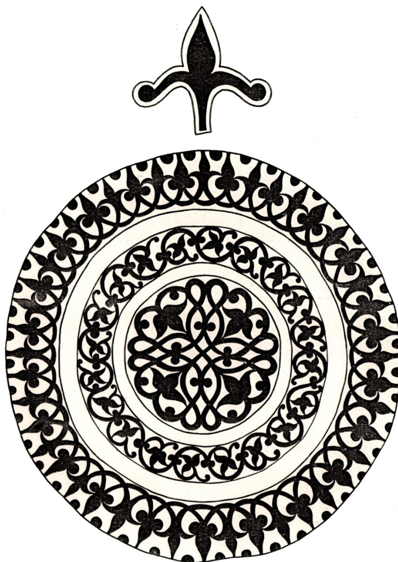
Рис. 7. Круглый медальон с растительным орнаментом на обратной стороне надмогильного памятника 889 г. хиджры /1484–85 гг. из с. Кумух. Прорисовка