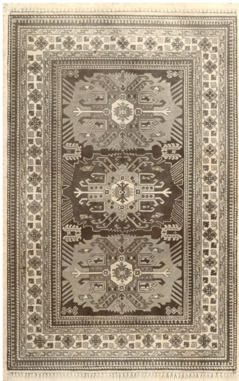
Рис. 11. Лезгинский ковер «Гассан-кала» из с. Ахты. Сер. XX в. Центральный широкий бордюр обрамлен узкой каймой, состоящей из геометризованных трилистников в соответствии с техникой и материалами ковроткачества. По Э.В. Кильчевской и А.С. Иванову