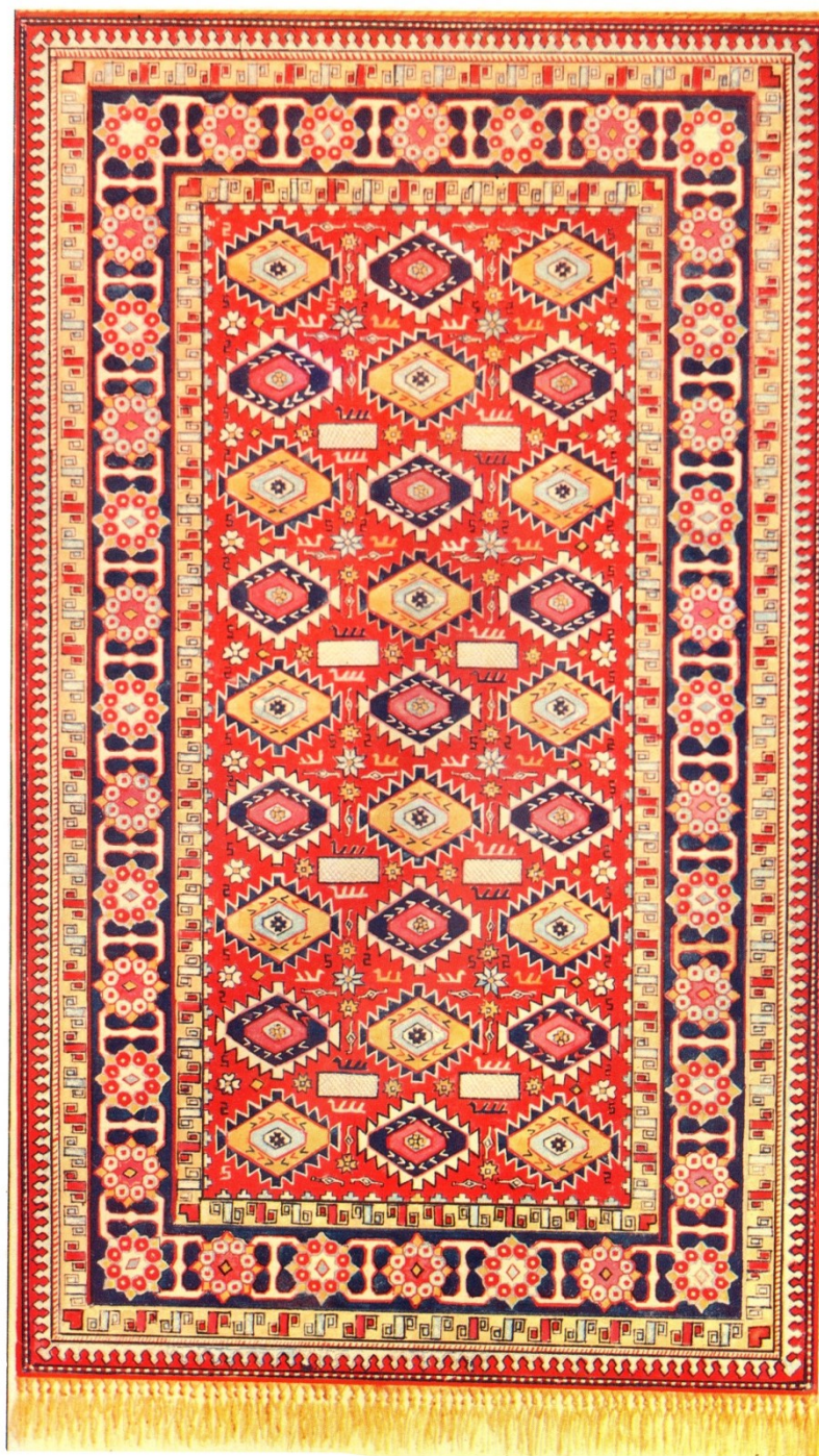
Рис. 9. Азербайджанский ворсовый ковер «Арсалан» кубинской группы. XIX в. Крайняя узкая полоска ковра – кайма древнего происхождения, образованная последовательно чередующимися по системе раппорта трилистниками, принявшими геометрические формы в соответствии с техникой и материалами ковроткачества. По Л.Г. Керимову