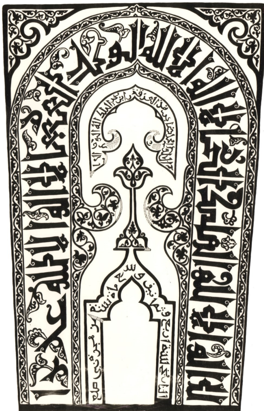
Рис. 1. Надмогильный памятник 783 г. хиджры / 1381–82 гг. из с. Кубачи с арабскими надписями и растительным орнаментом. Кладбище «Бидахъ хуппе»