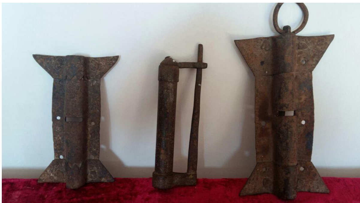
Рис. 4. Замки харбуцких мастеров из краеведческого музея с. Кица (Дахадаевский район). В центре висячий замок цилиндрической формы. 2016 г.