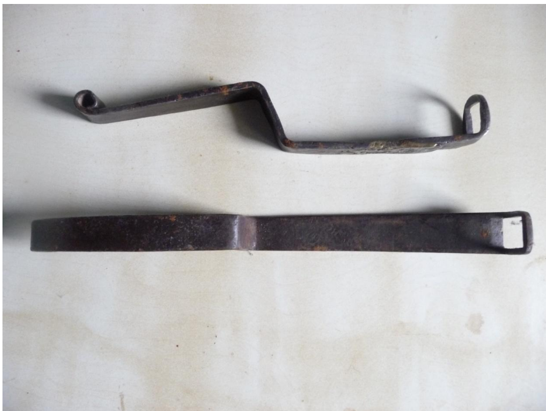
Рис. 5. Пружинный ригель-сердечник запирающего механизма накладного кузнечного замка. С. Кубачи.