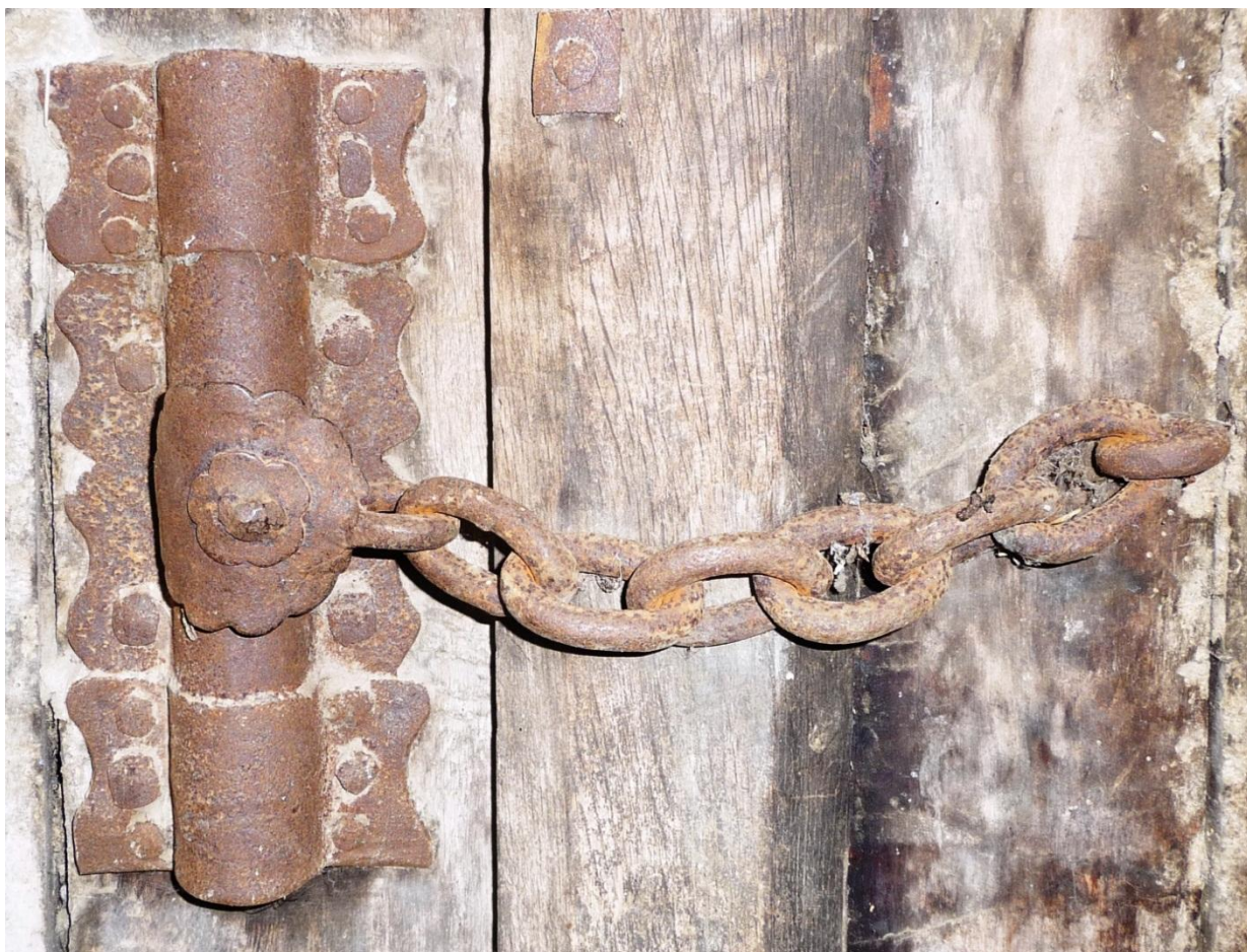
Рис. 3. Накладной замок позднего времени (1930-1950-е годы). Старое с. Кубачи.