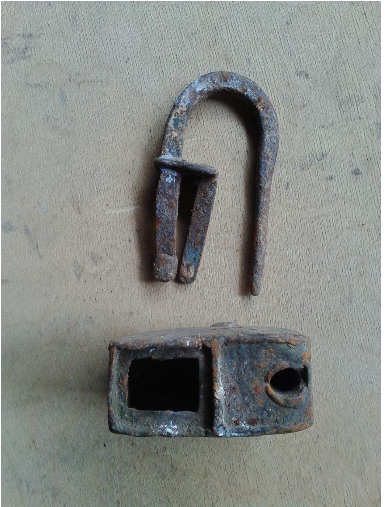
Рис. 8. Коробчатый висячий замок («замок для сундука») с пружинным механизмом (с 4 усиками). С. Кубачи. Частное собрание.