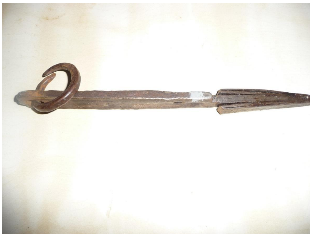
Рис. 6. Ключи накладных кузнечных замков.