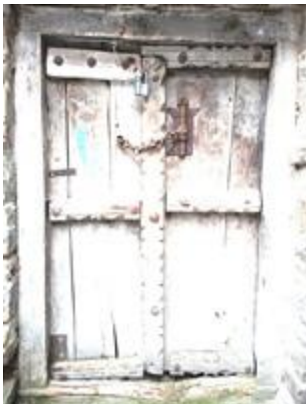
Рис. 1. Дверь хлева с кузнечным накладным замком. С. Кубачи. 2016 г. Верхний квартал. Дом Миркиевых.