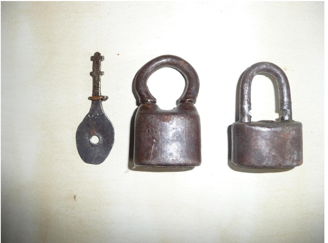
Рис. 9. Гиревидные замки начала XX в. (фабричная продукция). С. Кубачи. Частное собрание.