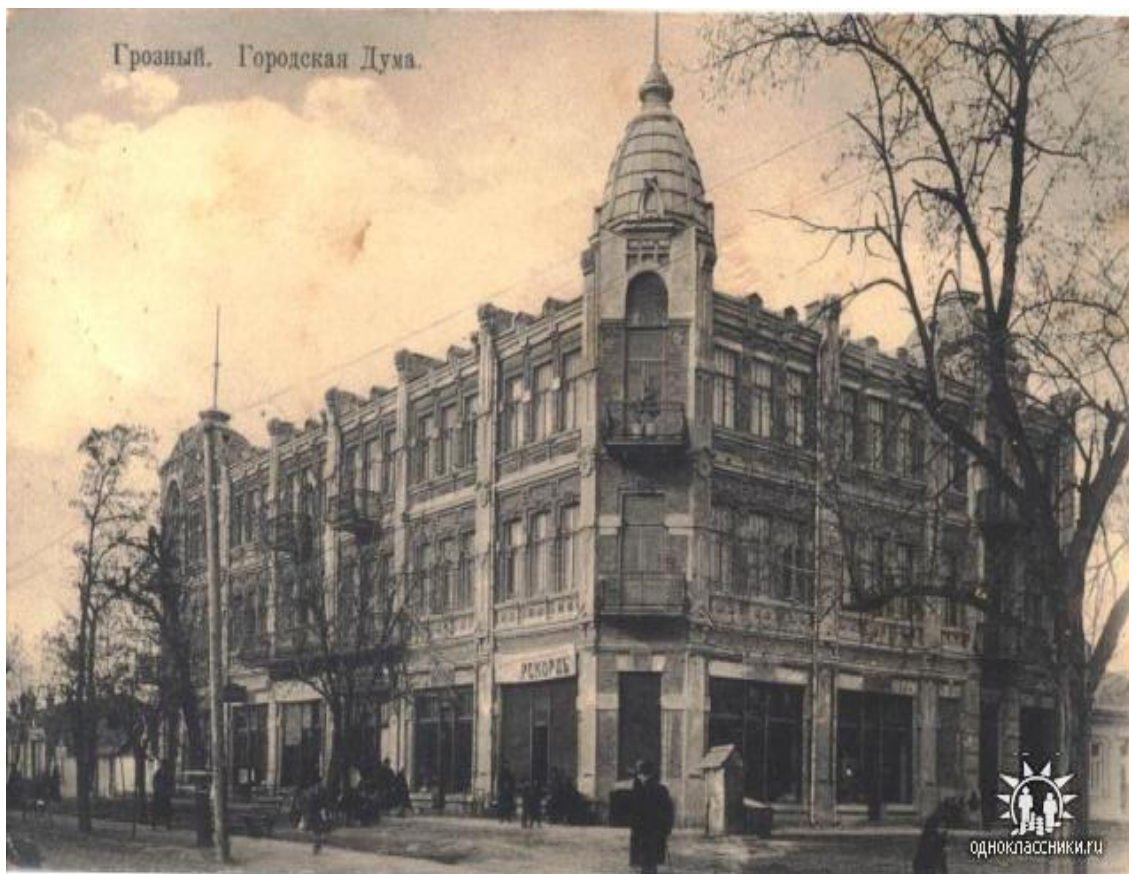
Фото 3. Дом Мирзоевых в г. Грозном