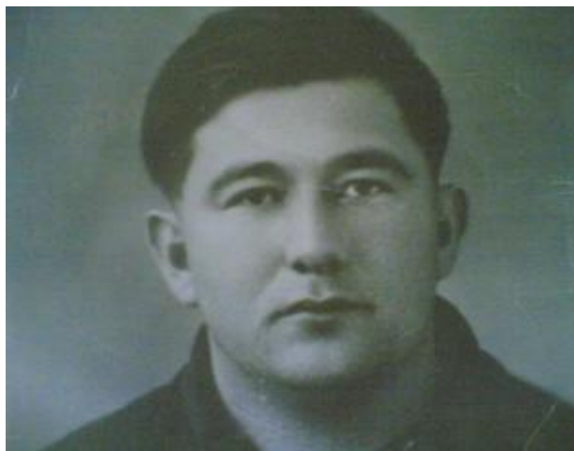
Фото 4. Эсембаев В.М. (1932–2014)