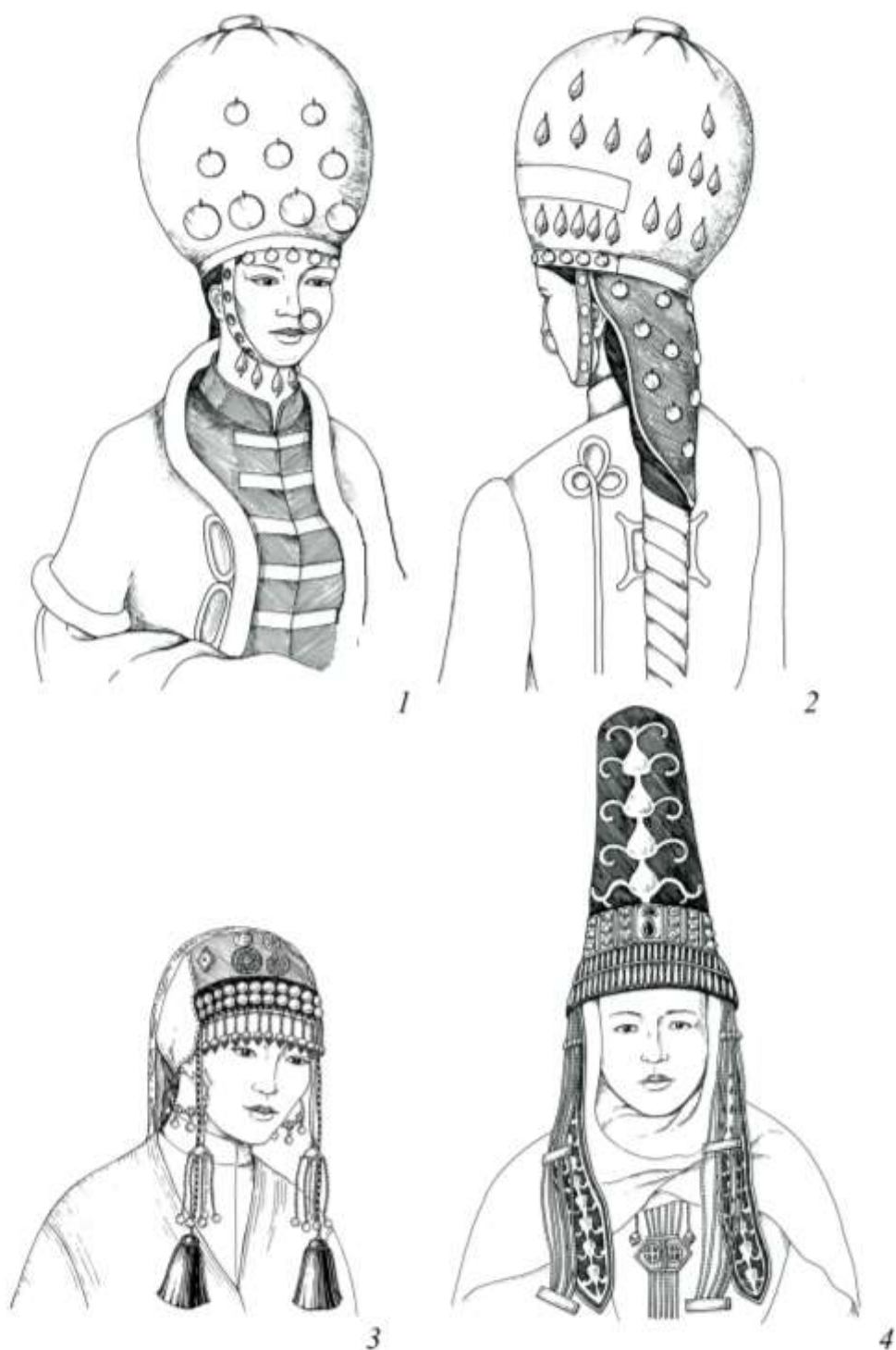
Рис. 2. Женские головные уборы ногойского костюма.

1,2 - рисунки автора по репродукции картины Д. Шлаггера "Ногайки Северного Причерноморья нач. XIX в." (Опубликовано: Калмыков И.Х., Керейтов Р.Х., Сикашев А.И. , 1988. С.127); 3 - реконструкция автора по фото ( Гаджиева С.Ш. , 1976. С.150); 4 - рисунок автора по фото ( Гаджиева С.Ш. , 1976. С.146).