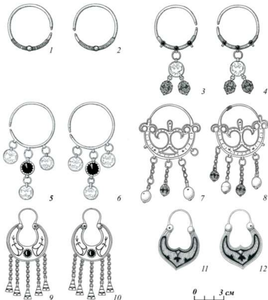
Рис. 4. Образцы серёг ногайских женщин.

1-2 - кольцевые серьги “доьнгелек кулакшын”, серебро, вставка из бирюзы; 3-4 - кольцевые серьги “доьнгелек кулакшын”, серебро, вставки из сердолика, подвески из монет и филигранных шариков с зернью; 5-6 - кольцевые серьги “яспан”, серебро, вставка из цветного стекла, подвески из монет; 7-8 - кольцевые серьги “аяклы кулакшын”, серебро, ажурная резьба, гравировка, подвески из полых литых и филигранных шариков; 9-10 - кольцевые серьги “такта кулакшын”, серебро, вставка из сердолика, гравировка, зернь; 11-12 - кольцевые серьги “такта кулакшын”, серебро, гравировка, чернь.