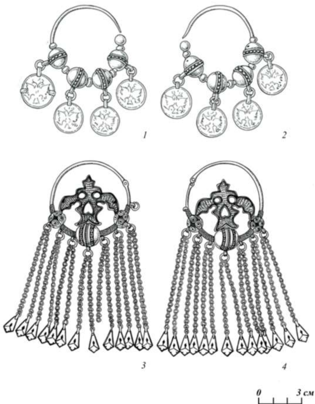
Рис. 3. Образцы серёг ногайских женщин.

1-2 - кольцевые серьги "туьймели кулакшын", серебро, нанизанные литые полые шарики, подвески из монет, зернь; 3-4 - кольцевые серьги "туьймели кулакшын", серебро, нанизанные литые полые и филигранные шарики, подвески из парных цепочек, ажурная резьба, гравировка, чернь.