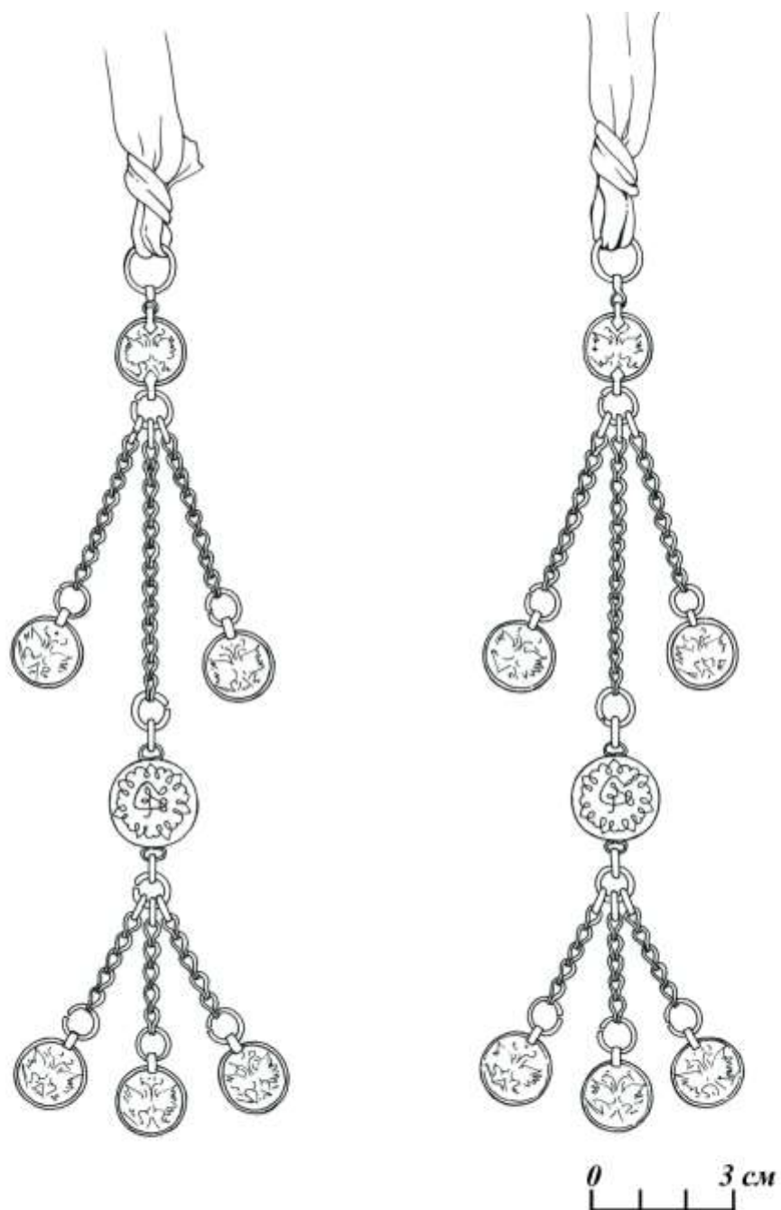
Рис. 6. Накосное украшение ногойских женщин. Подвески из цепочек и монет (реконструкция по описанию информатора М. Койлюбаевой и сохранившимся отдельным деталям украшения).