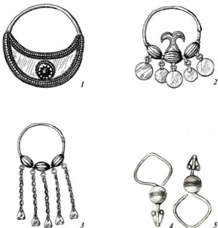
Рис. 5. Образцы серёг ногайских женщин.

1 - кольцевая серьга “такта кулакшын”, серебро, вставка из цветного стекла, накладная филигрань, чернь, зернь (По: Булатова А.Г., Гаджиева С.Ш., Сергеева Г.А., 2001, С. 192. Рис.1); 2 - кольцевая серьга “туьймели кулакшын”, серебро, нанизанные бусины в виде зёрен, подвески из монет, ажурная резьба, гравировка (По: Булатова А.Г., Гаджиева С.Ш., Сергеева Г.А., 2001, С. 192. Рис. 2); 3 - кольцевая серьга “туьймели кулакшын”, серебро, нанизанные бусины в виде зёрен, подвески из цепочек (По: Булатова А.Г., Гаджиева С.Ш., Сергеева Г.А., 2001, С. 192. Рис. 4); 4 - фигурные серьги “буькбе”, серебро, нанизанный полый шарик, зернь (По: Гаджиева С.Ш., 1976. С. 171. Рис. 2).