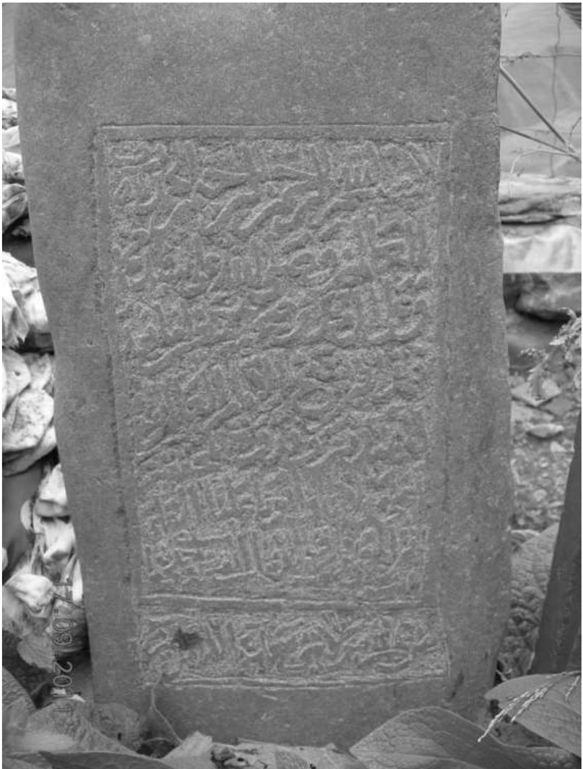
Надмогильная плита ученого Али ал-Кили. Сел. Кусур