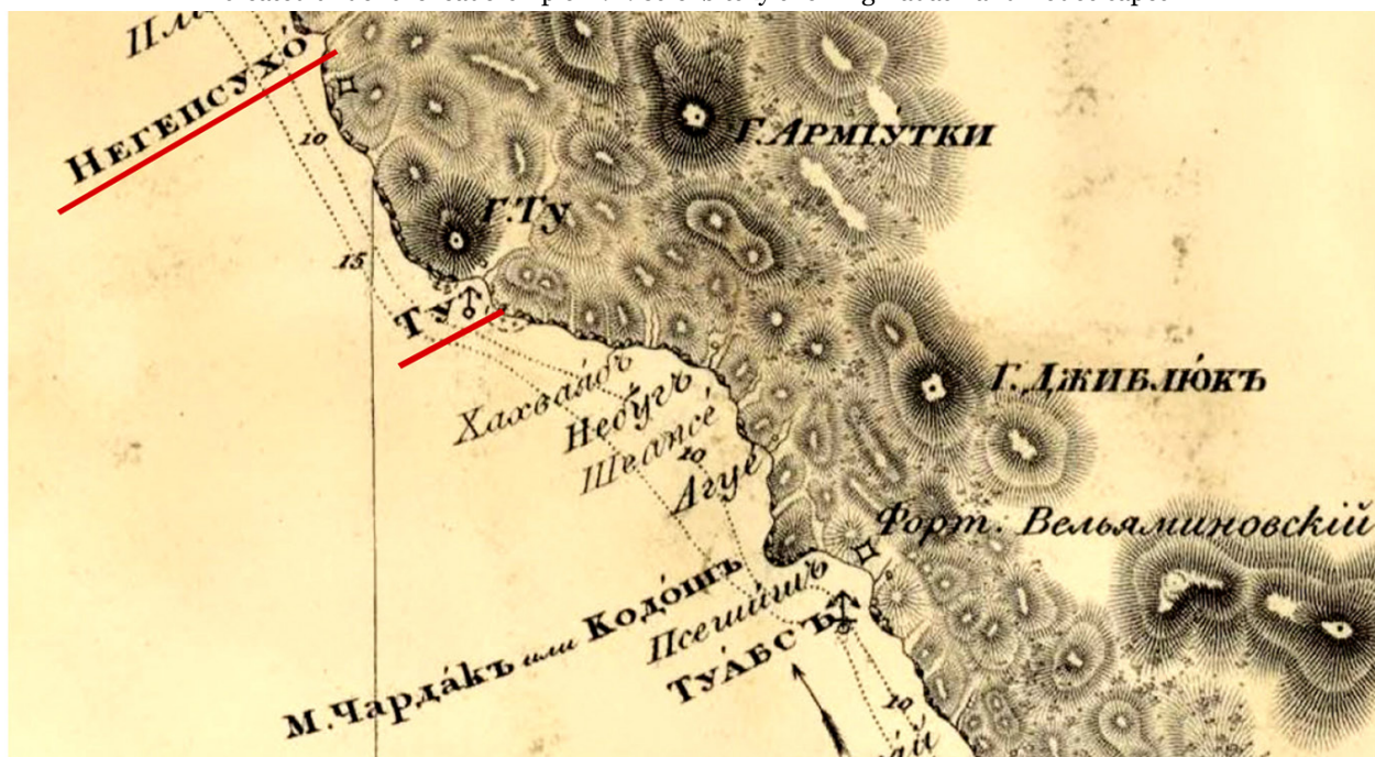
Рис. 6. Бухта реки Ту (Ольгинка). Фрагмент «Карты восточного берега Черного моря от мыса Таклы до реки Риона» из «Атласа Чёрного моря», 1841