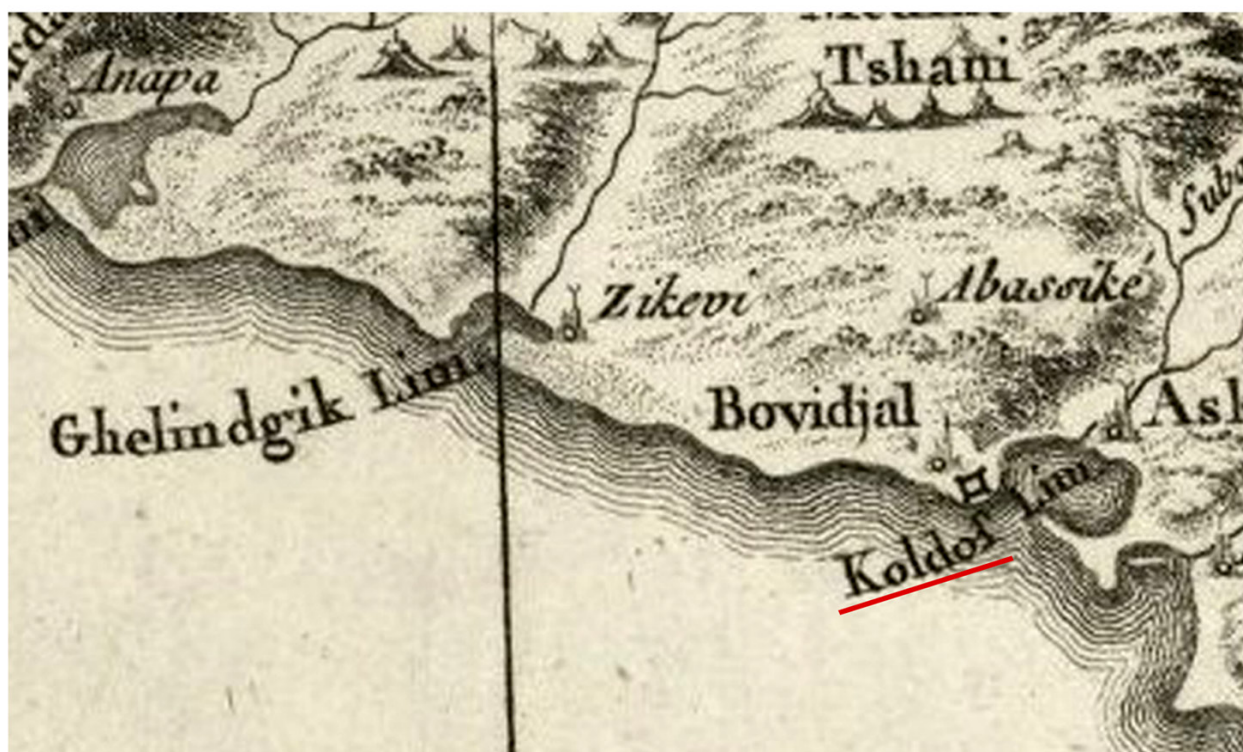
Рис. 3. Бухта Колдош. Фрагмент «Карты северной части Оттоманской империи. Татары Кубанские» Джованни Антонио Рици-Дзаннони, 1774 г.

Fig. 3. Koldosh Bay. Fragment of Giovanni Antonio Rizzi-Zannoni's "Carte de la partie septentrionale de l'empire otoman. Tatares de Kuban", 1774