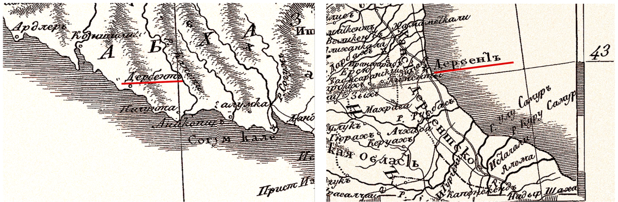
Рис. 2. Фрагменты Карты Кавказских земель с частью Великой Армении, изданной С. Броневским. Составлена А. Максимовичем. СПб., 1823 г. с указанием двух Дербентов