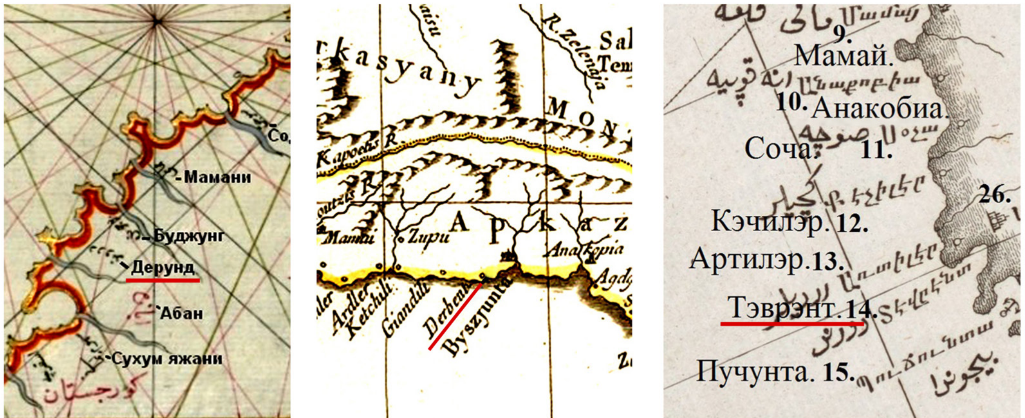
Рис. 1. Фрагменты исторических карт с локализацией Дербента: 1 - Карта Чёрного моря Пири Реиса 1525 г.; 2 - Карта окрестностей Черного моря Паоло Санти, 1776 г.; 3 - Кара Дениз, Карта Черного моря и окрестностей Понта. 1820 г.