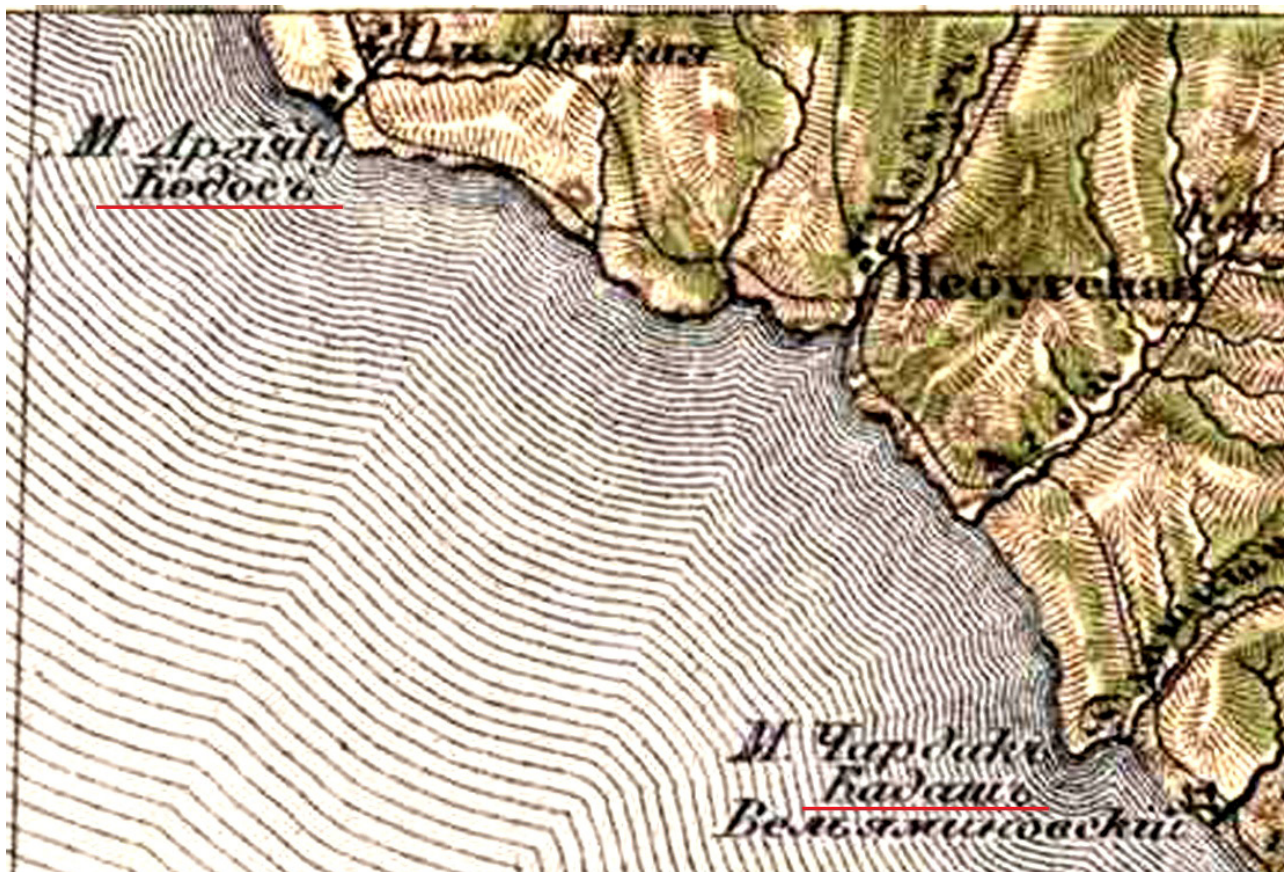
Рис.5. Фрагмент «Специальной карты Европейской России», созданной под руководством И.А. Стрельбицкого с указанием мысов Кадаш и Кодос