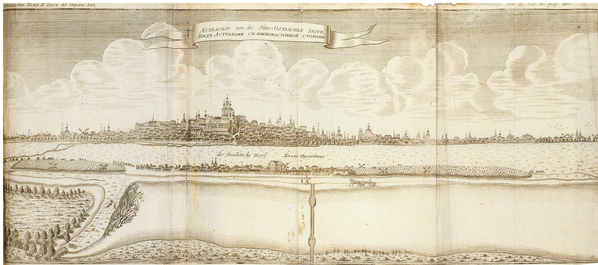
Рис. 2. Вид Астрахани с юго-восточной стороны [4, с. 361]