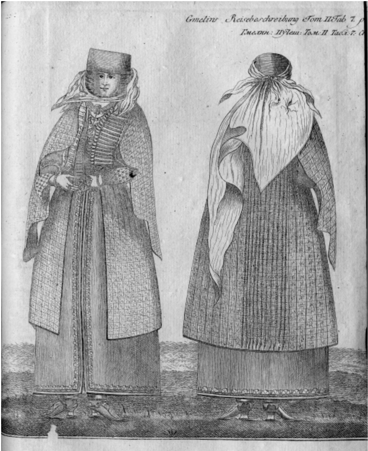
Рис. 5 Армянка в традиционном костюме [4, с. 221]