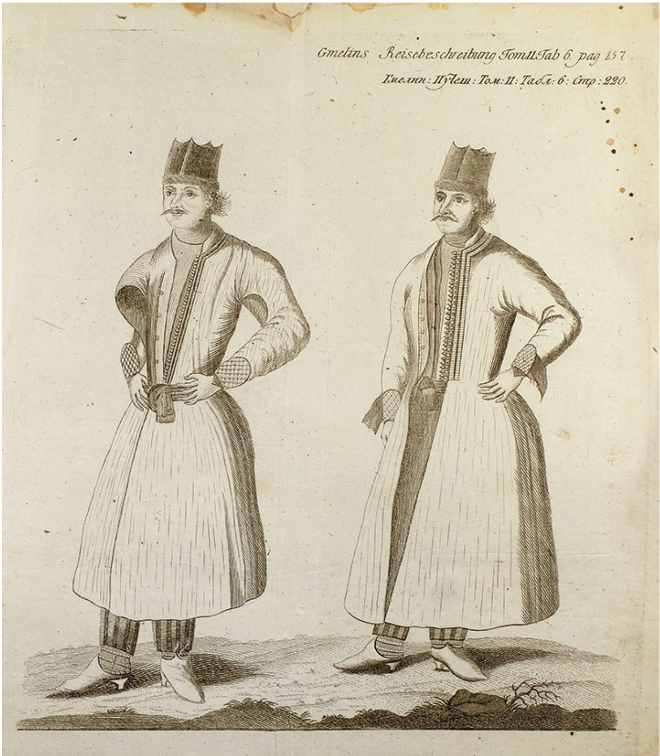
Рис. 4. Армянин в традиционном костюме [4, с. 220]