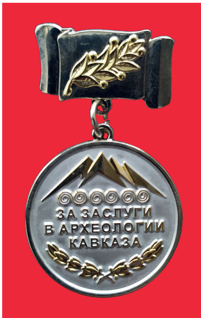
Рис.2. Медаль "За заслуги в археологии Кавказа".