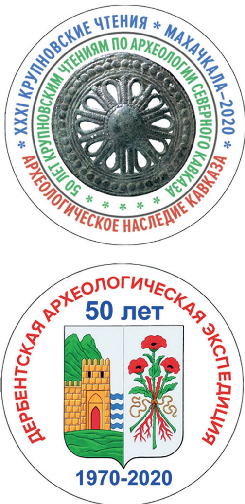
Рис.1. Эмблемы XXXI Крупновских чтений.