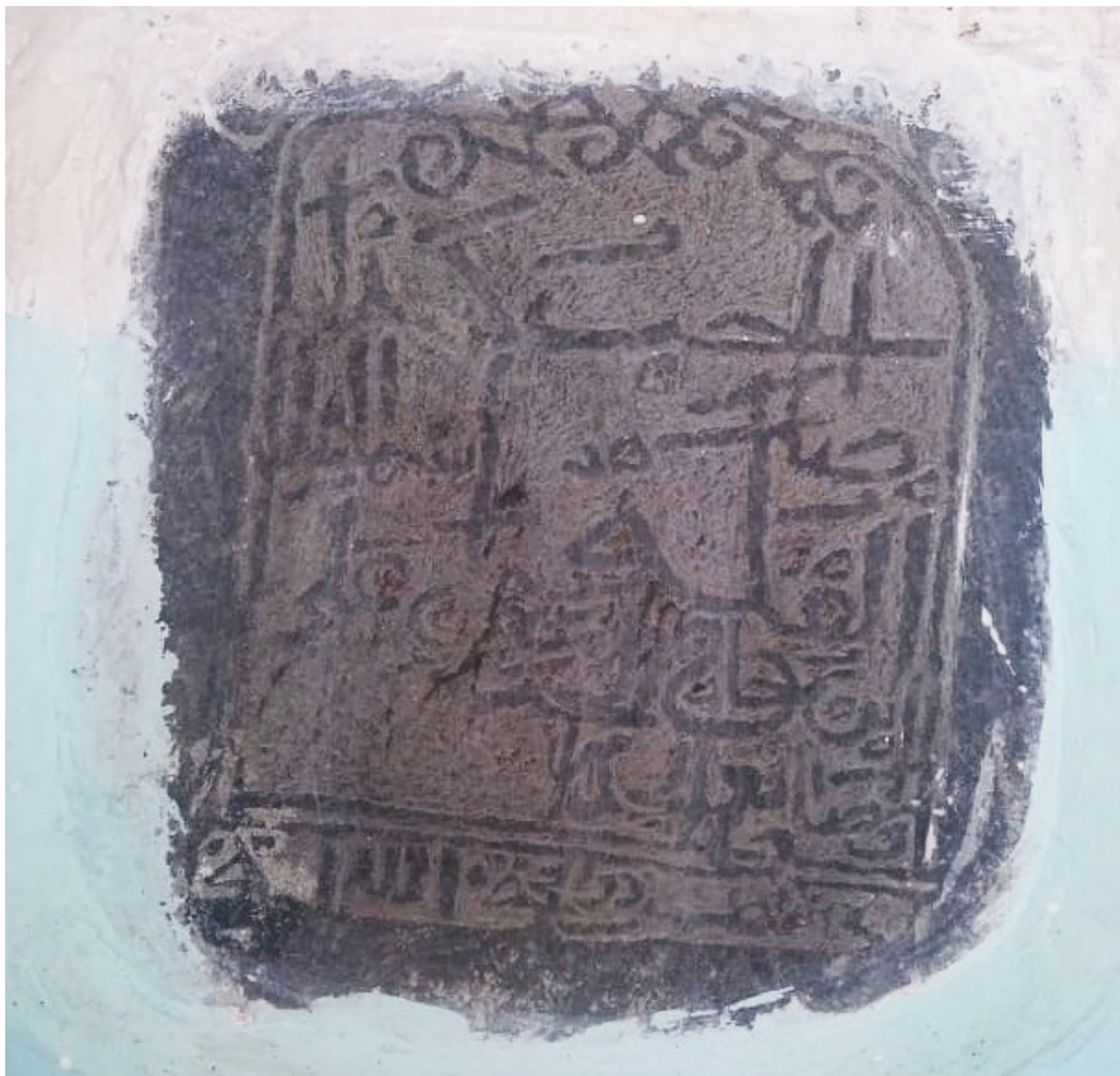
Рис. 1. Закатальский район. Джарский муниципалитет. сел. Джар. Арабоязычная надпись на стене «Кичилализул» хужра

The author thanks the residents of the Dzhar municipality of the Zakatala region of the Republic of Azerbaijan, who provided support during the study. The author is also grateful for specific and valuable information they provided. The author is also pleased to express his gratitude to the reviewers for the valuable commentaries that were taken into account upon completion of the manuscript.