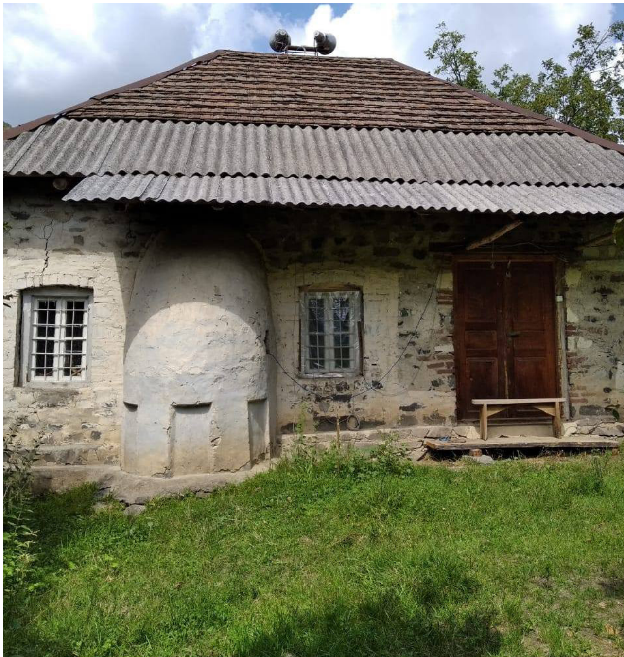
Рис. 2. Закатальский район. Джарский муниципалитет. сел. Джар. «Кинтазул» худжра. Общий вид