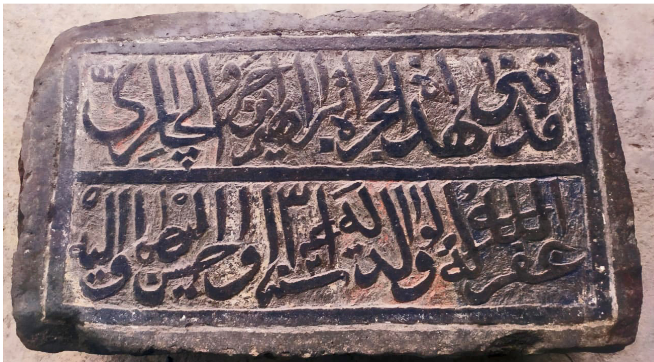
Рис. 4. Закатальский район. Джарский муниципалитет. Сел. Цильбан. Арабоязычная надпись на стене квартальной хужры