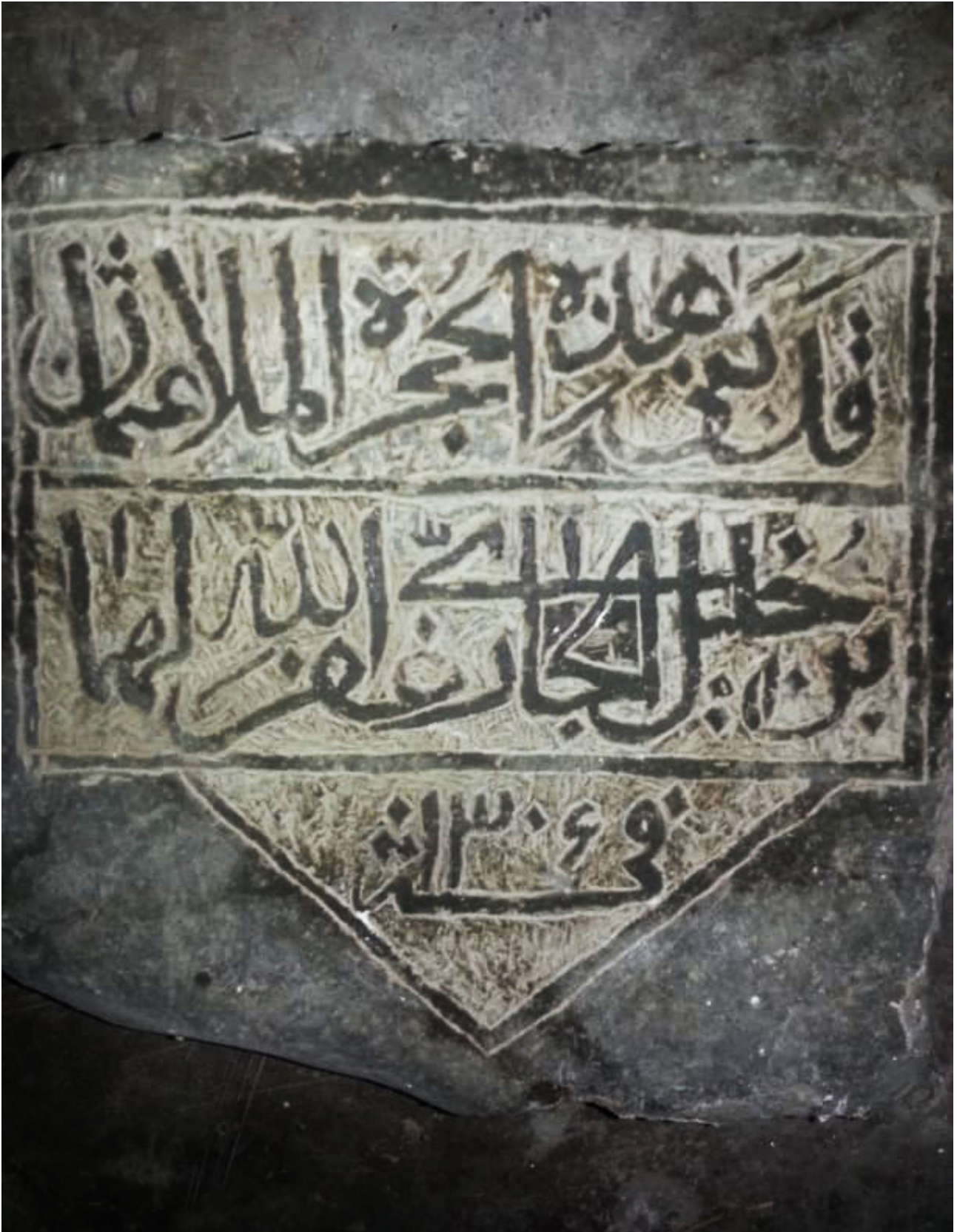
Рис. 3. Закатальский район. Джарский муниципалитет. сел. Джар. Арабоязычная надпись на стене хужры «ДигИниязул»