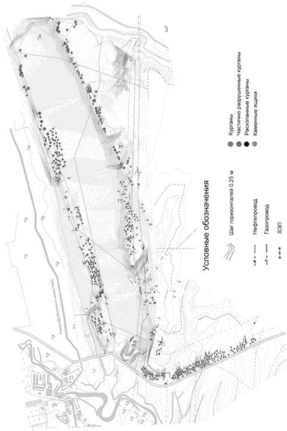
Рис. 2. План юго-восточной части южной группы Паласа-сырского курганного могильника