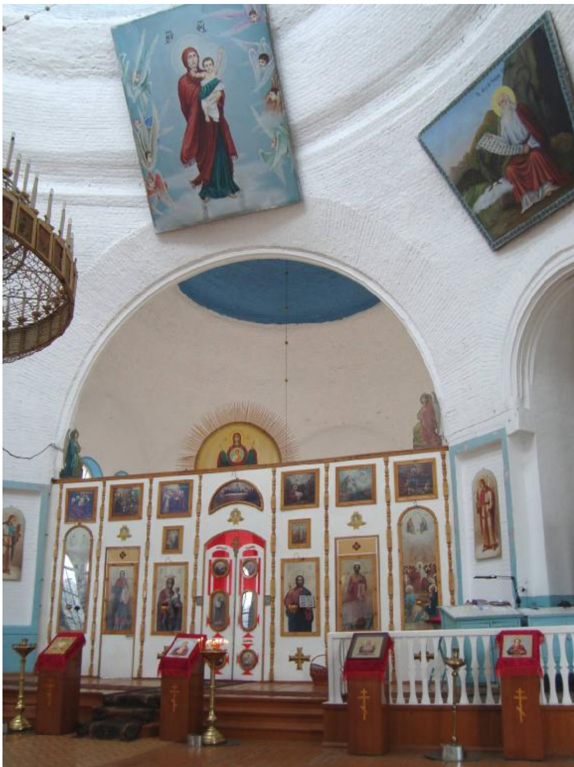
Рис. 6. Хасавюрт. Церковь Знамения Пресвятой Богородицы. Интерьер. Западная часть, иконостас. 2011 г.