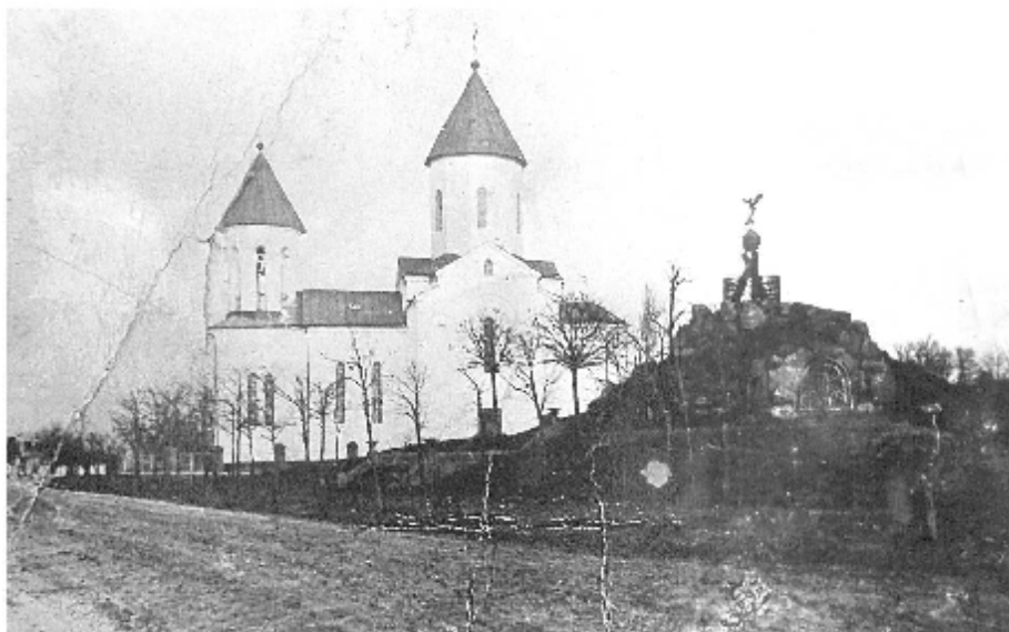
Рис. 1. Хасавюрт. Военная церковь в честь Преподобного мученика Андрея Критского.