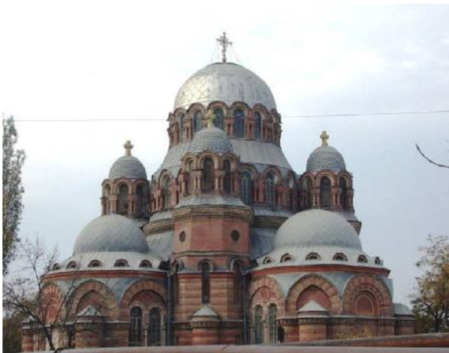
Рис. 4. Хасавюрт. Церковь Знамения Пресвятой Богородицы. Вид с юго-востока. 2011 г.