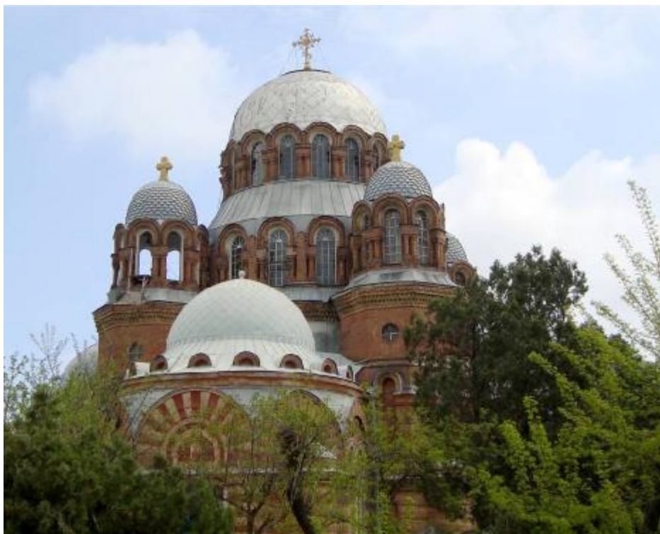
Рис. 5. Хасавюрт. Церковь Знамения Пресвятой Богородицы. Вид с запада. 2011 г.