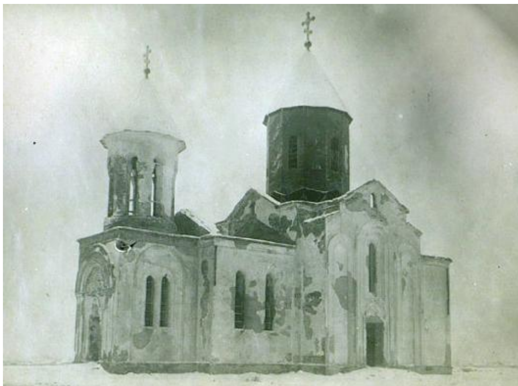
Рис. 2. Хасавюрт. Клуб в здании полковой церкви. 1928 г. Инв. № 2193-20.