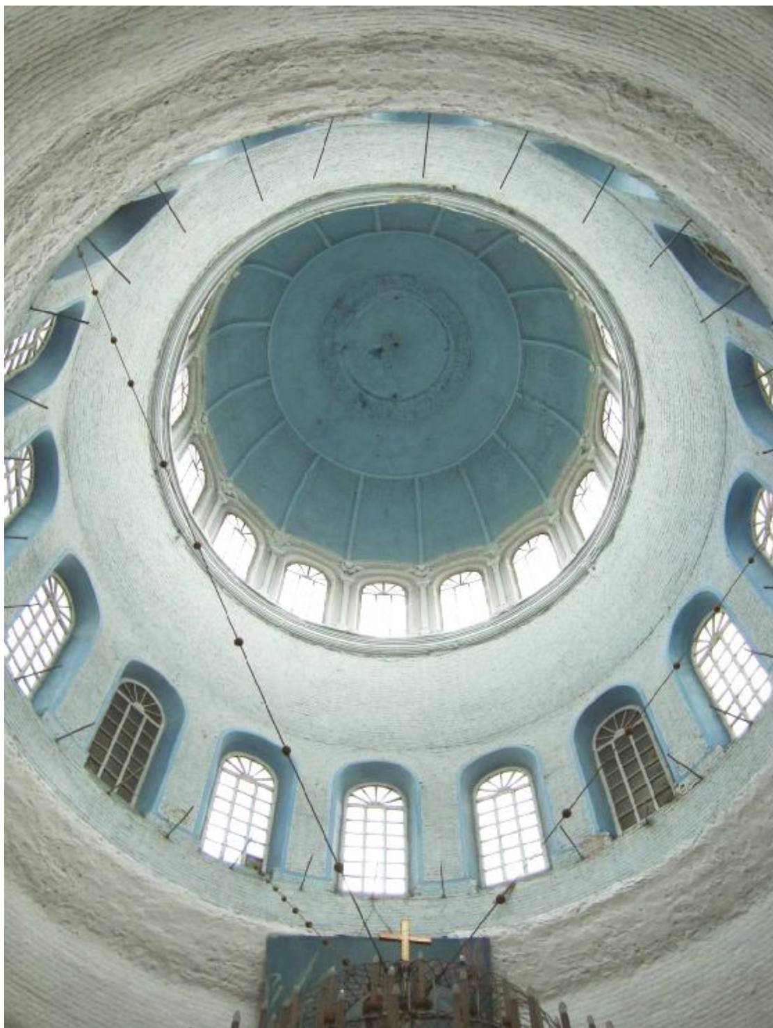
Рис. 7. Хасавюрт. Церковь Знамени Пресвятой Богородицы. Интерьер. Подкупольное пространство. 2011 г.