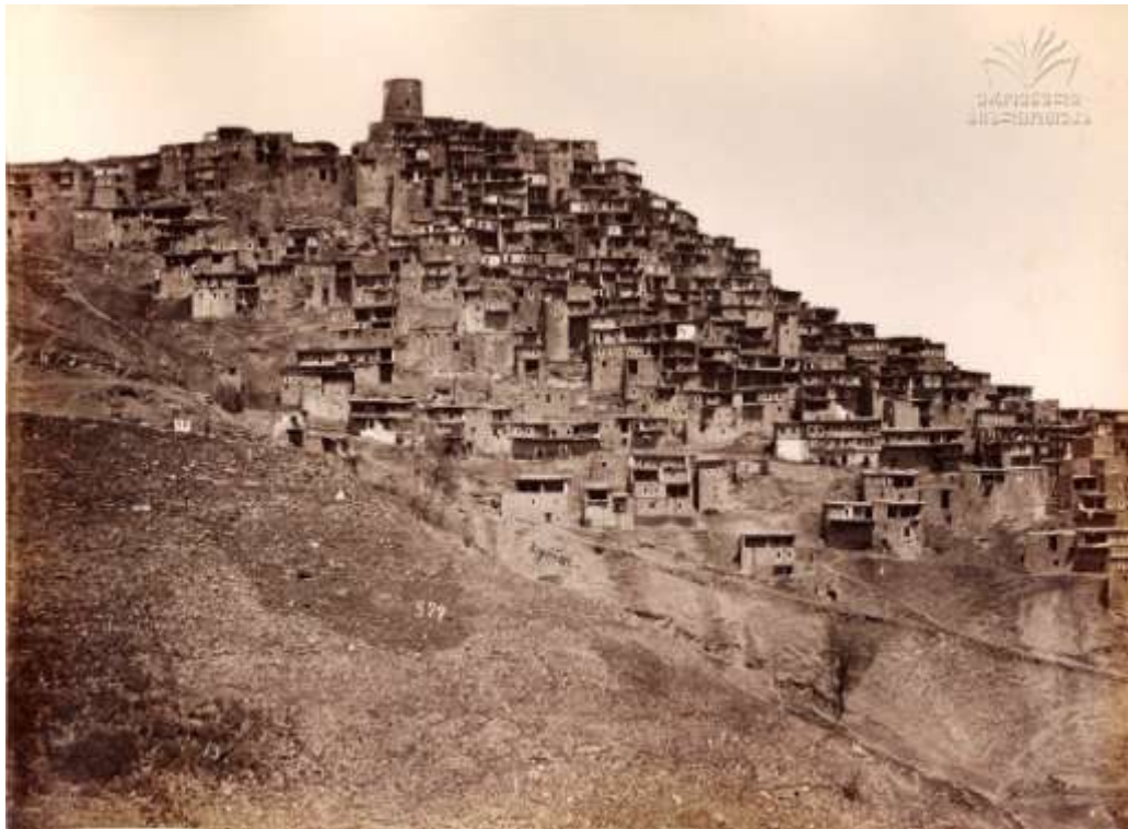
А. Роинашвили. Фото Кубачи (Вид №1)