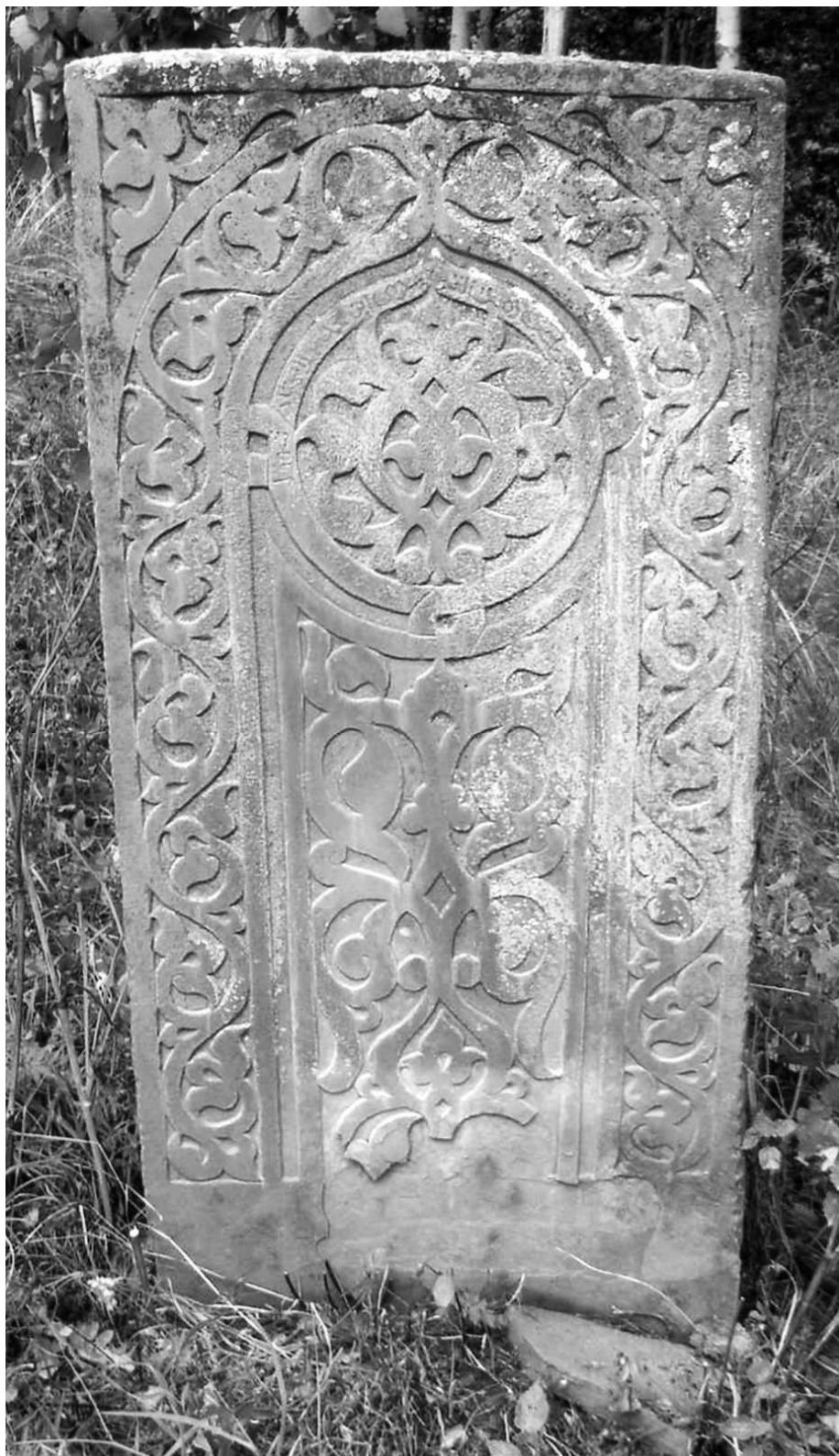
Рис. 18. Надмогильный памятник XV в. из с. Сутбук.