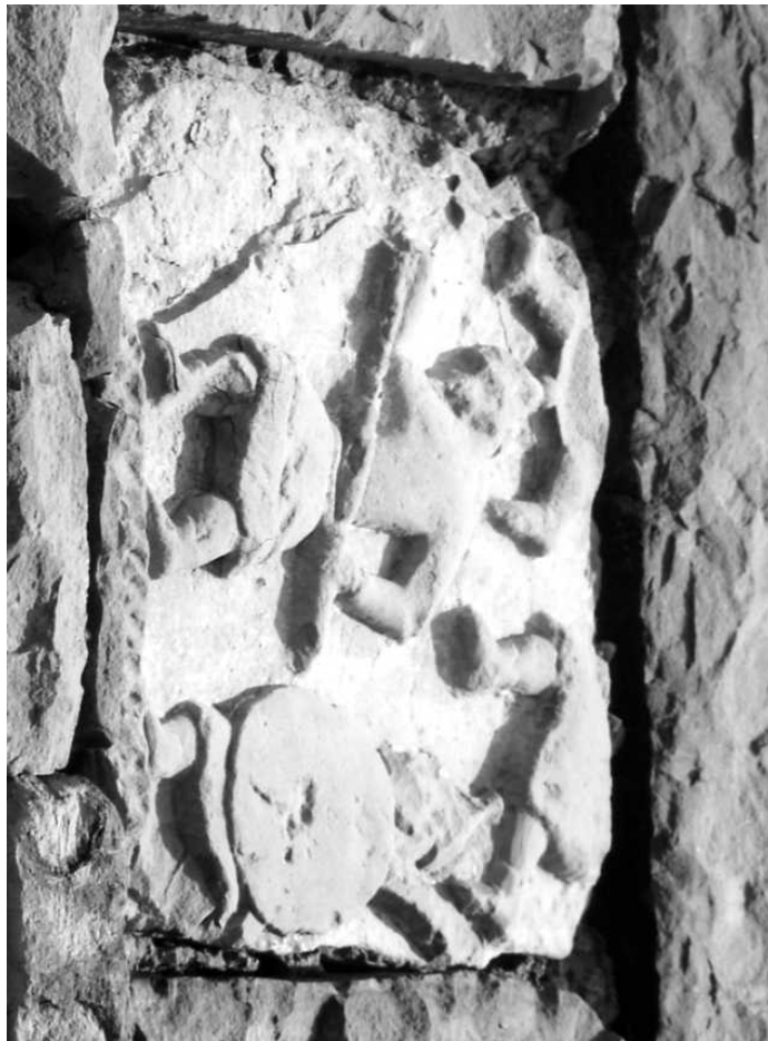
Рис. 4. Каменный рельеф – архитектурная деталь XIV–XV вв. с изображением батальной сцены. Пос. Кубачи.