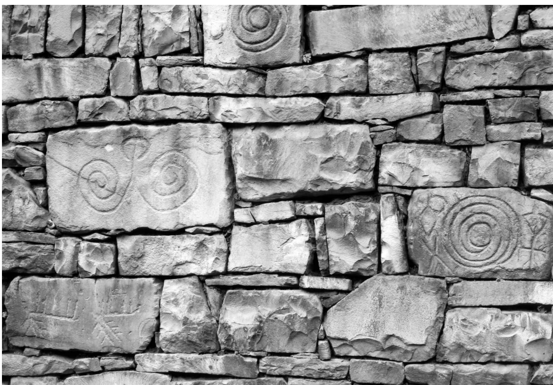
Рис. 8. Петроглифы в кладке северной стены одного из полуразрушенных домов в восточной части с. Ицари.