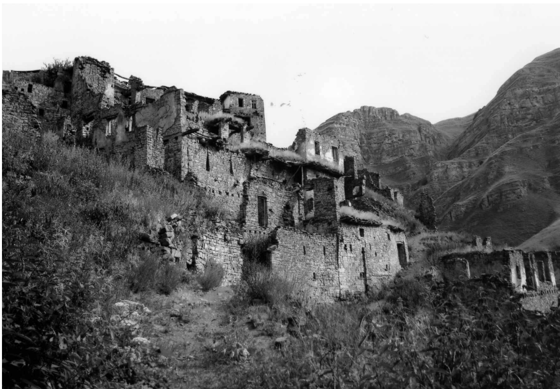
Рис. 7. Часть застройки с. Ицари. Разрушающиеся дома. Вид с юго-запада.