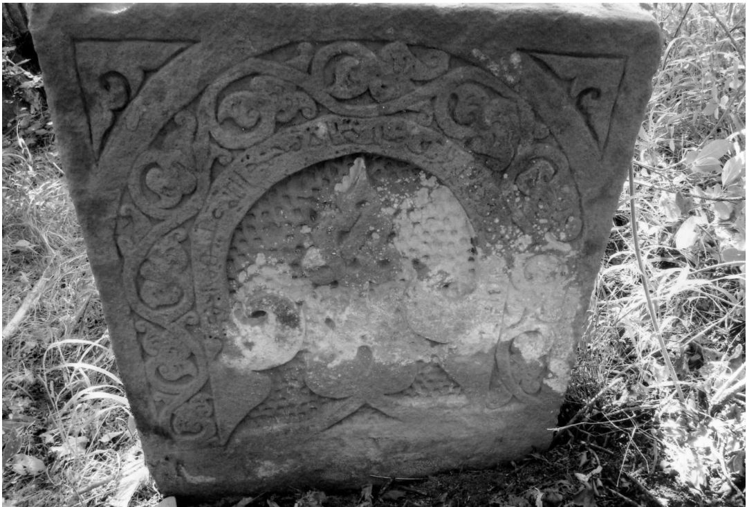
Рис. 10. Надмогильный памятник XIV–XV вв., находящийся на северо-западном кладбище с. Калакорейш.