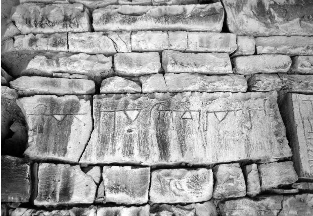
Рис. 9. Арабская кувфическая надпись в кладке северной стены одного из полуразрушенных домов в восточной части с. Ицари.