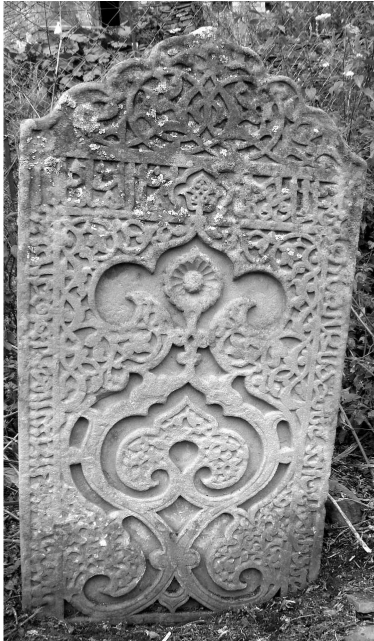
Рис. 12. Надмогильный памятник середины XVII в., находящийся на кладбище с. Дибгалик.