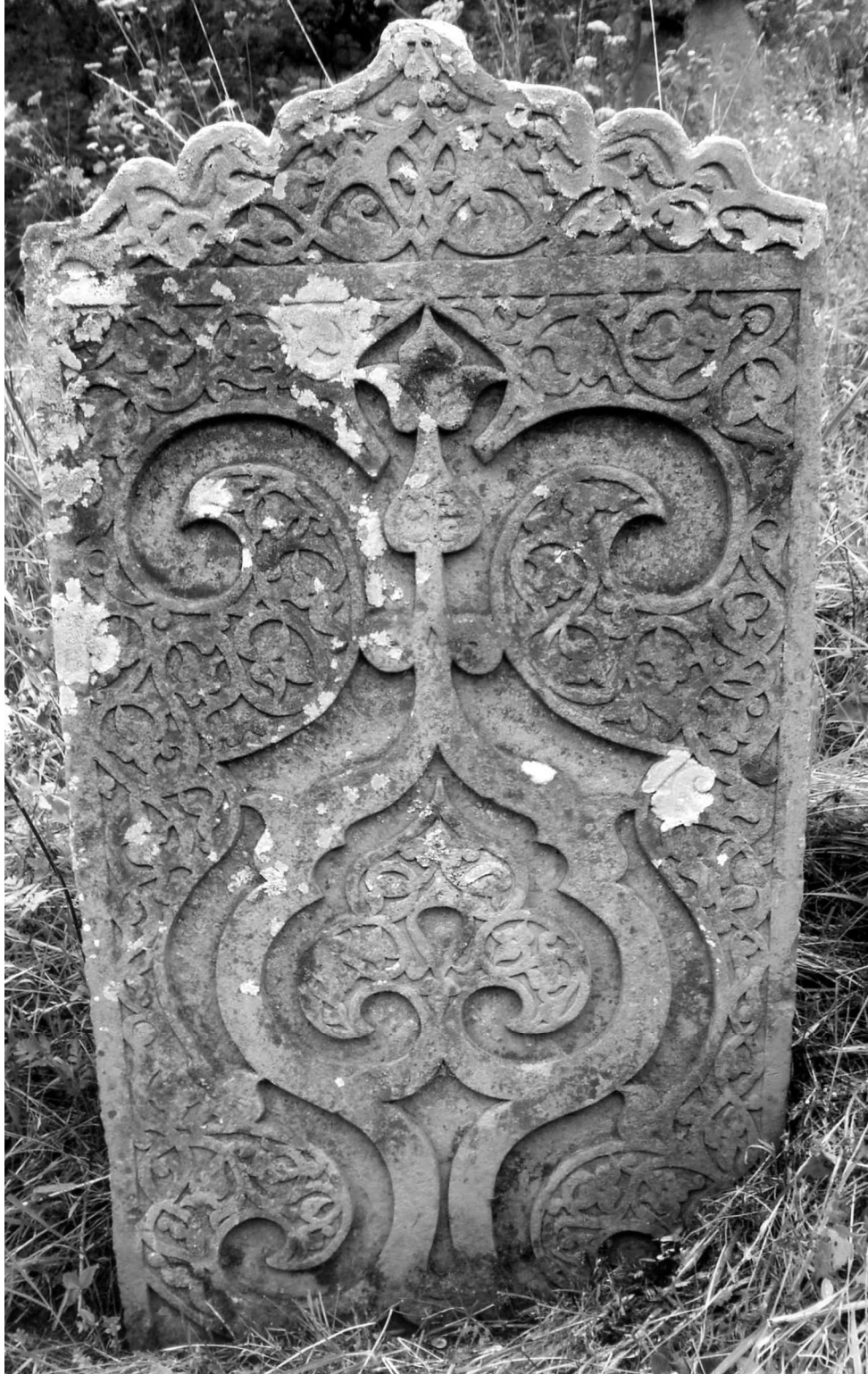
Рис. 13. Надмогильный памятник середины XVII в., находящийся на кладбище самого нижнего квартала старой части пос. Кубачи.