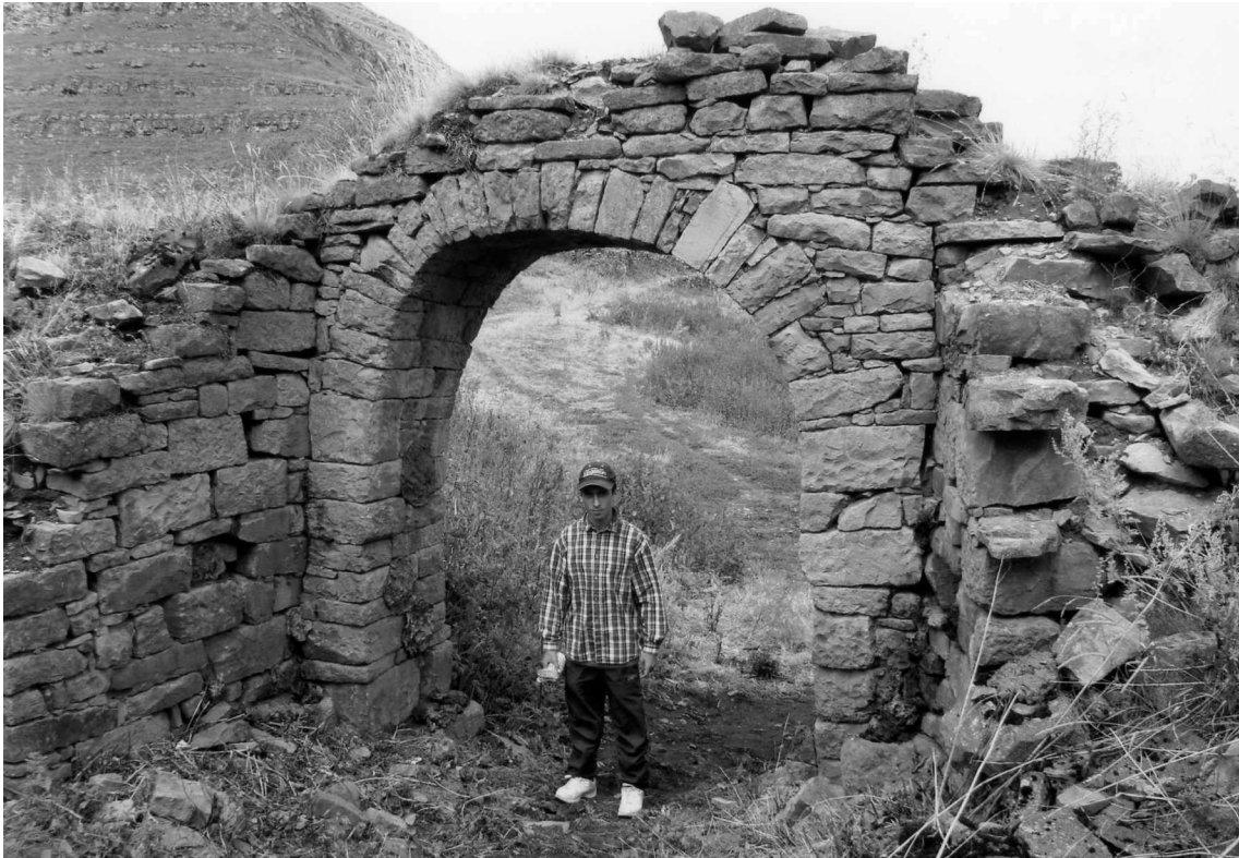
Рис. 5. Фрагмент крепостной стены у арочного входа в с. Амузги. Толщина стены 1,4 м. Вид с востока.