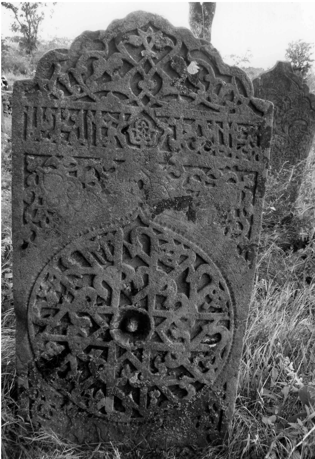
Рис. 11. Надмогильный памятник конца XVII в., находящийся на уцмиевском кладбище в с. Калакорейш.