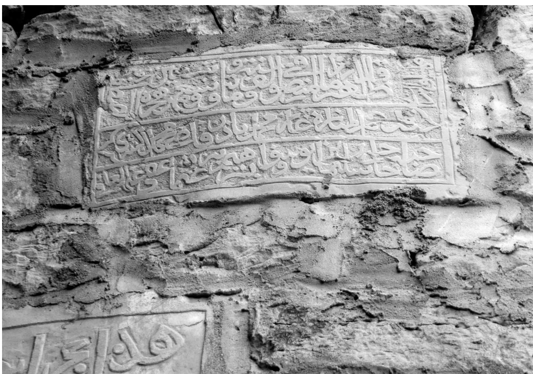
Рис. 16. Каменный рельеф с арабской надписью в стене минарета о его восстановлении Газимухаммедом в 1199 г. хиджры (1785 г.). С. Калкни.