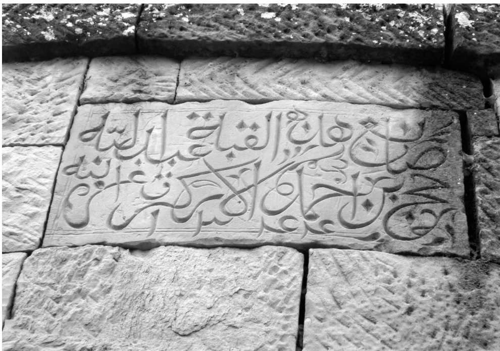
Рис. 15. Арабская надпись в стене мавзолея: «Строитель этого купола Абдуллах-Хаджи, сын Ахмада ал-Уркараха. 1344 г. хиджры» (1925 г.). С. Калкни.