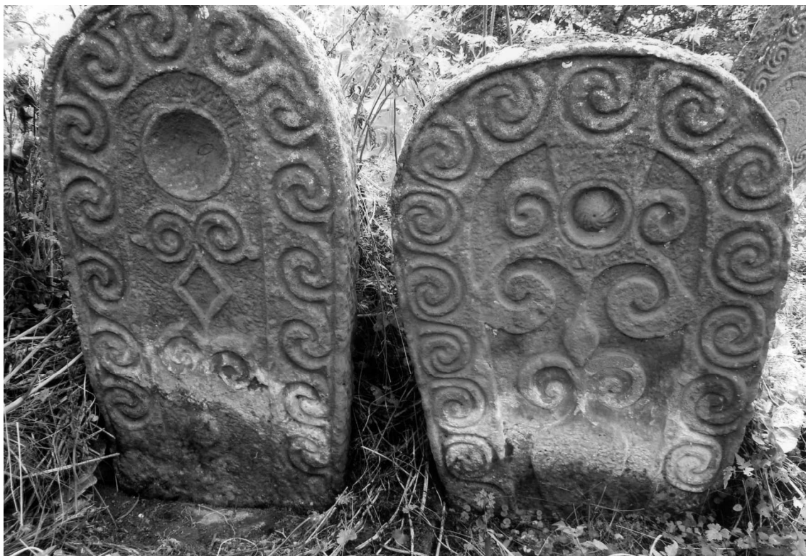
Рис. 17. Два надмогильных памятника XIV–XV вв., находящихся на кладбище «Ахъти хІурби» в с. Меусиша.