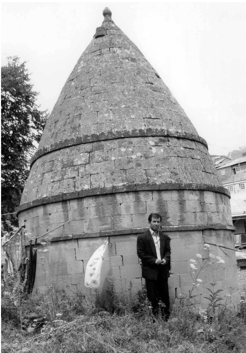
Рис. 14. Мавзолей суфийского шейха, построенный, вероятно, в XIV–XV вв. и ремонтировавшийся неоднократно в последующее время. С. Калкни.