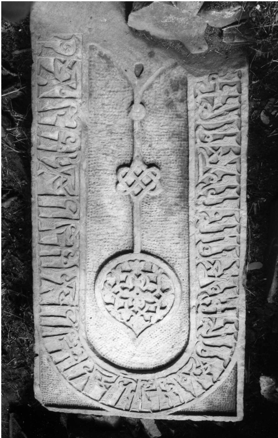
Рис. 1. Надмогильный памятник с датой 787 г. хиджры = 1385 г. нашего лето-счисления. Пос. Кубачи.