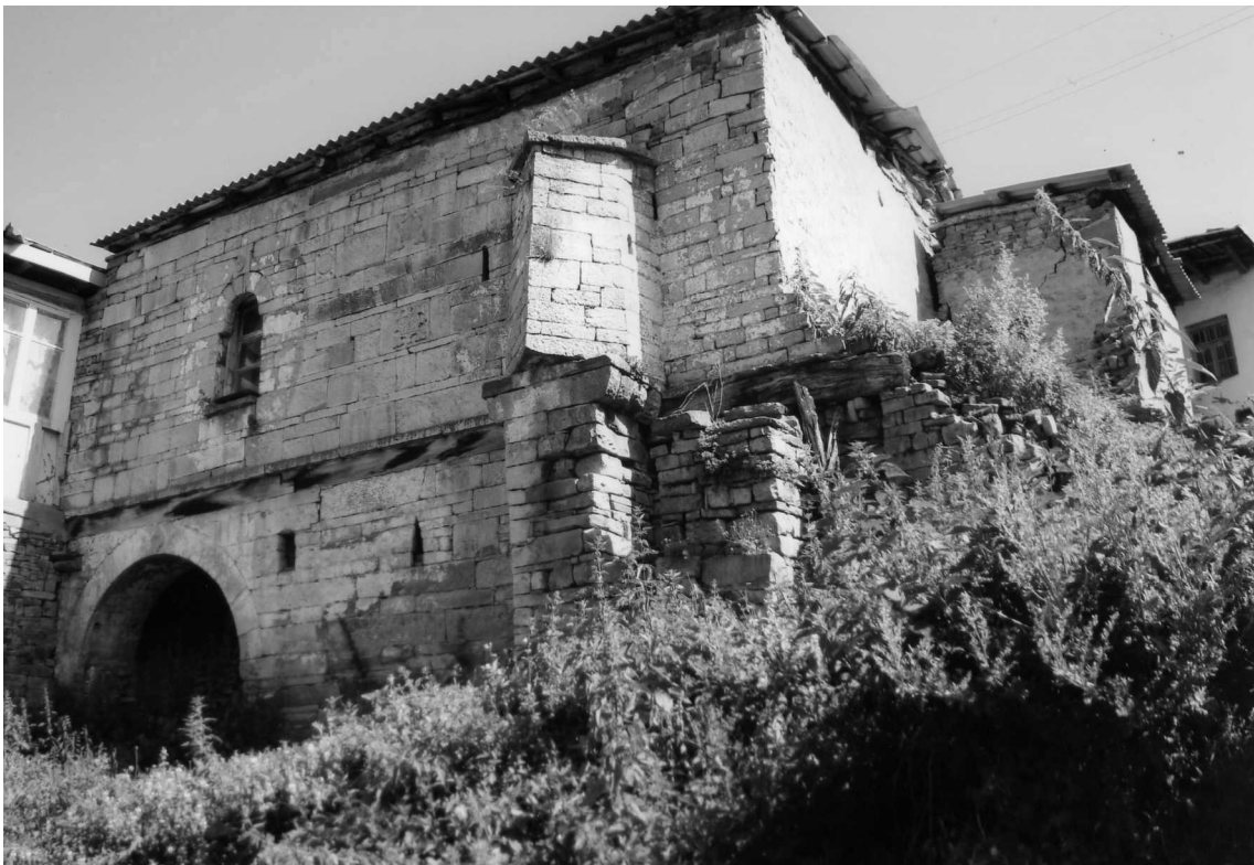
Рис. 6. Мечеть в с. Ашты. Вид с юго-востока.