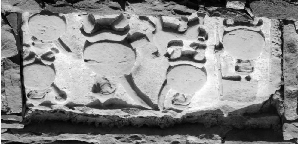
Рис. 3. Каменный рельеф – архитектурная деталь XIV–XV вв. с изображением батальной сцены. Пос. Кубачи.