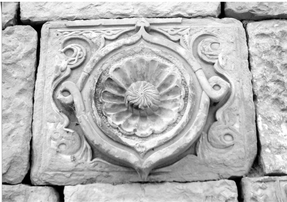
Рис. 20. Каменный рельеф – архитектурная деталь XVI в., находящийся в кладке стены северного фасада мечети. С. Шири.