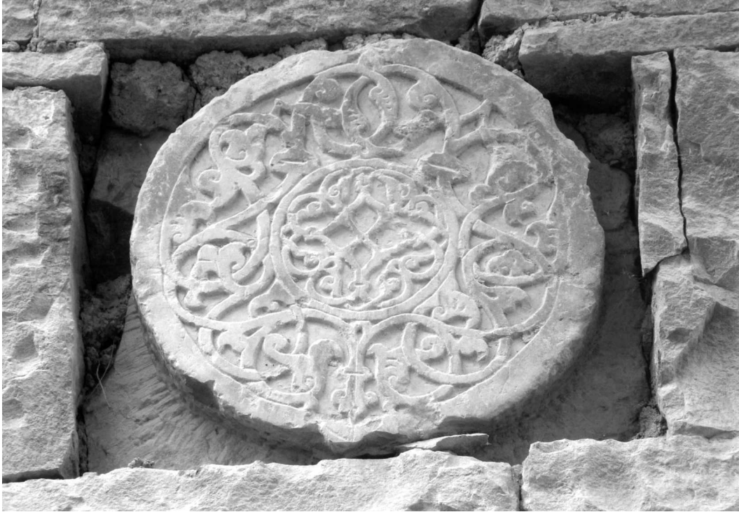
Рис. 19. Каменный рельеф – архитектурная деталь XV в. с растительным орнаментом. Вставлен в кладку северной стены мечети в с. Харбук.